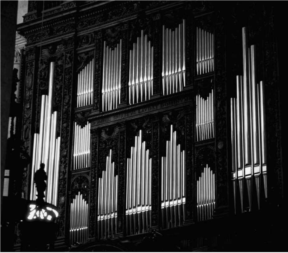
Orgue de la Catedral de Tarragona després de la restauració, 2013.

t'estan dient: «Vinga, acaba de pujar que et falta poc per arribar», ja no saps si ets en aquest món o al Paradís.