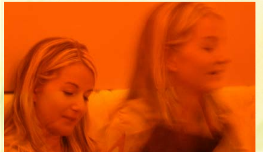
Sprechbar - In gemütlicher Lokation Sprachbarrieren überwinden und dazu lernen.

zu erweitern oder aufzufrischen. Gesprochen wird in gemütlicher Atmosphäre in den verschiedensten Sprachen und über die verschiedensten Themen. Nähere Informationen zum Projekt „Sprechbar“ sind im AStA-Portal auf der Internetseite www.studierbar.com zu finden.