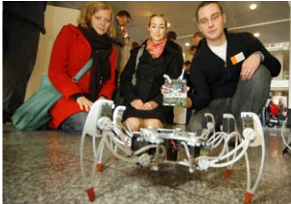
Sechs Spinnenbeine geben die Richtung an: Roboter FRODo kann sich ducken oder über Hindernisse steigen.