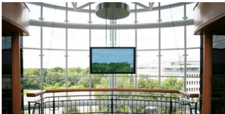
Der überdimensionale Duschkopf lässt ab und zu ein Tröpfchen fallen.

In der Empfangshalle wurde mit einer außergewöhnlichen Brunneninstallation ein besonderer Akzent gesetzt: Ein überdimensionaler Duschkopf, angebracht an der Decke der obersten Etage des Hotels, lässt einzelne Tropfen