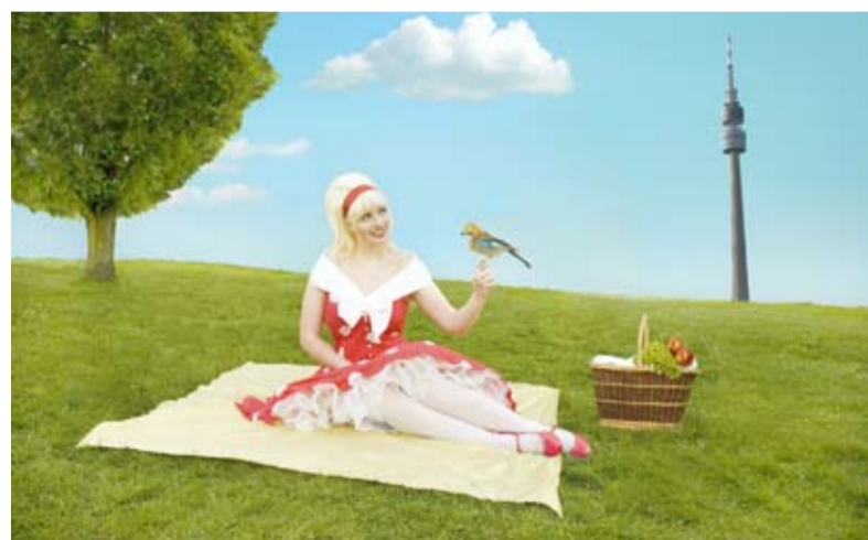
„Pleasant Sunday Puppet“ von Natalie Plaskura ist Sieger- und Titelmotiv für den Kalender „(in) Dortmunder Parks 2009“.

Das achtköpfige Podium traf auf einen Hörsaal, der angesichts des Themas erstaunlich leer war. Nur rund 35 Studierende hatten die Zeit gefunden, über das vollgepackte Studium zu diskutieren. Eine Erklärung, die kursierte: „Keine Zeit, musste studieren“.