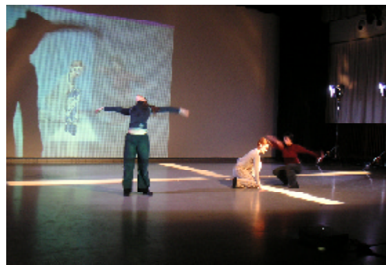
Tänzerinnen und Tänzer in der interaktiven Performance am Fachbereich Design