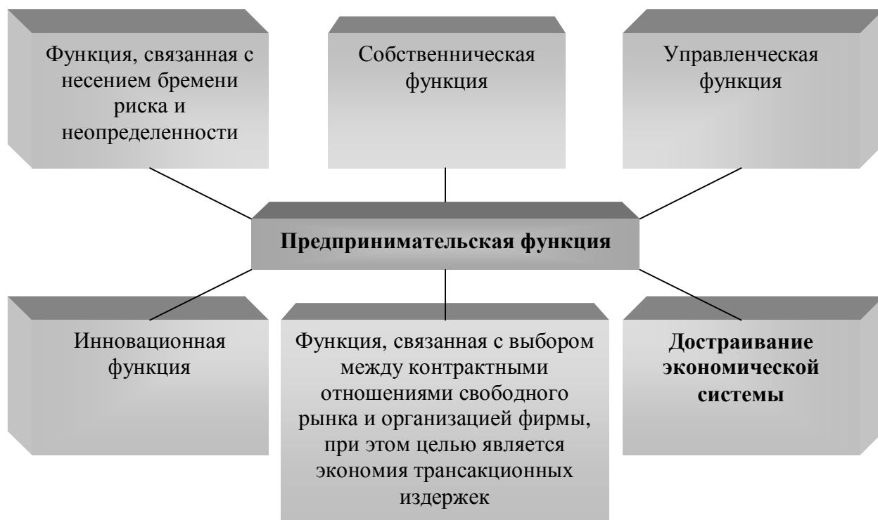
Рис. 2. Типология предпринимательской функции

Методологически для исследования феномена малого предпринимательства в рамках политико-экономического и институционального подходов автором использованы количественный и качественный критерии, позволяющие вскрыть экономическую сущность малого предпринимательства, традиционно сводимую всего лишь к содержанию этого понятия, определенного законодательными актами. Из этого сделан вывод о том, что понятие «малое предпринимательство» в процессе генезиса расширяется и требует научного уточнения для каждого этапа развития экономической системы, что и находит свое проявление в обогащении предпринимательской функции.