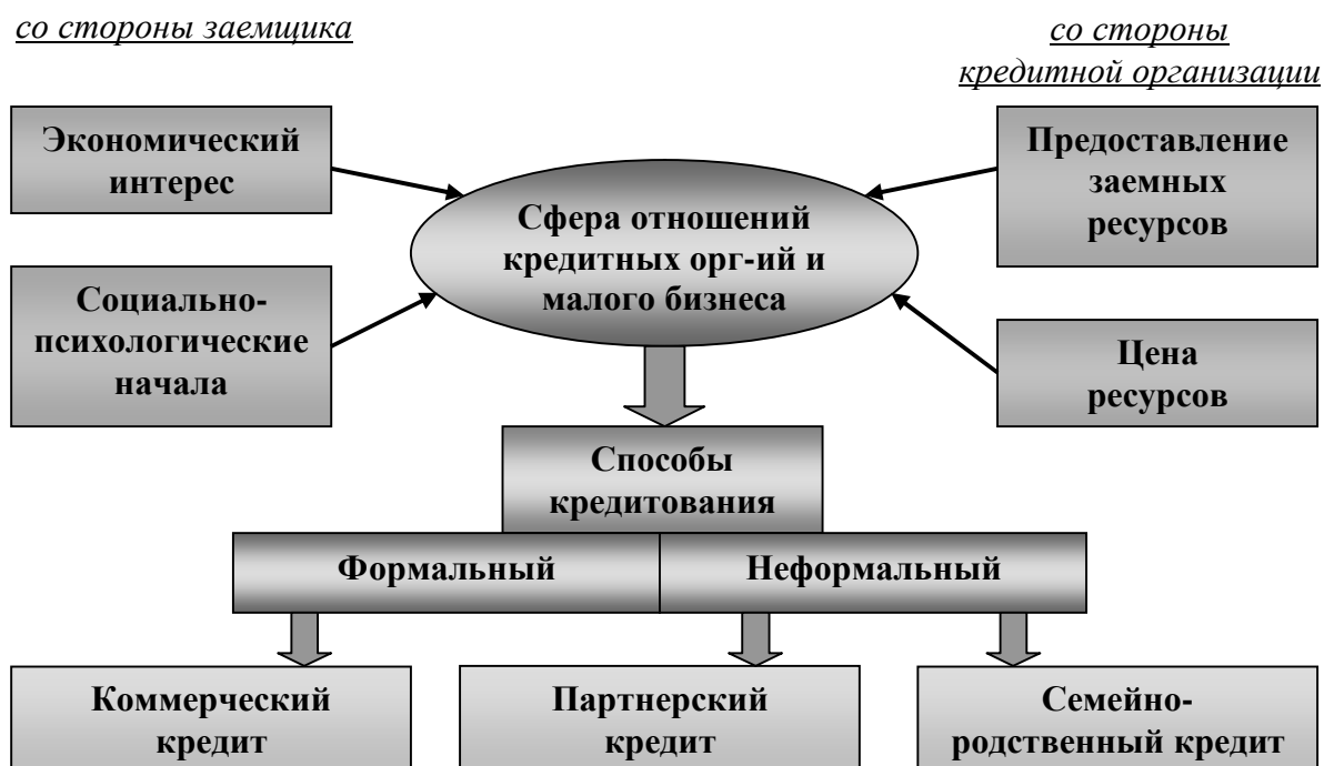
Рис. 4. Специфика института малого бизнеса как особого типа заемщика

На стадии контрактации экономических отношений требуется приложить немало организационных усилий для того, чтобы эти субъекты имели друг о друге реальное представление и располагали такой информационно-методической базой, которая бы позволяла объективно оценивать их экономические возможности. В работе расширяется понимание сферы экономических отношений субъектов малого предпринимательства и кредитных организаций на основе выявления специфики малого бизнеса как особого типа заемщика и как экономического института. Логика анализа представлена на рис. 4.