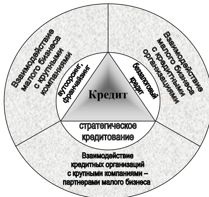
Рис. 3. Трехсторонний механизм взаимодействия

В ходе проведенного анализа рассмотрены существующие в экономической теории подходы к трактовке предпринимательства как объекта экономических исследований, а малого предпринимательства как специфической сферы приложения кредитных ресурсов для формализации малого предпринимательства в качестве экономической категории.