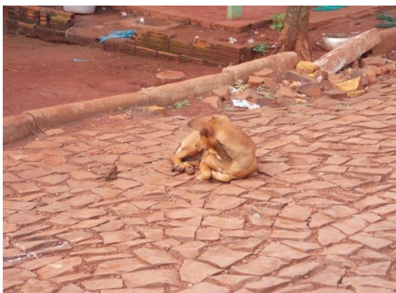
Figura 1. Cão abandonado no Bairro Esperança no município de Dois Vizinhos - Pr.

As palestras foram apresentadas pelos pibidianos nos períodos matutino e vespertino. Em cada turno, três pibidianos realizaram a apresentação da palestra, com duração em média de uma hora, utilizando-se do espaço físico do próprio colégio. Estas aconteceram em turmas individuais, com aproximadamente 28 a 30 estudantes, realizadas nas aulas de Ciências do Ensino Fundamental (do 6º ao 9º ano) e de Biologia do Ensino Médio (do 1º ao 3º). O número reduzido de alunos permitiu que estes utilizassem o espaço para questionamentos e relato de experiências, além de possibilitar que sanassem suas dúvidas sobre cuidados e casos de maus tratos aos animais (Figuras 1, 2, 3 e 4). A palestra foi proferida em 28 turmas do CEDV, além de também abranger os próprios professores, que disponibilizaram os horários de suas aulas.