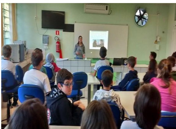
Figura 3. Pibidiana proferindo a palestra ESPERANÇA, no Laboratório de Biologia, Física e Química do CEDV.