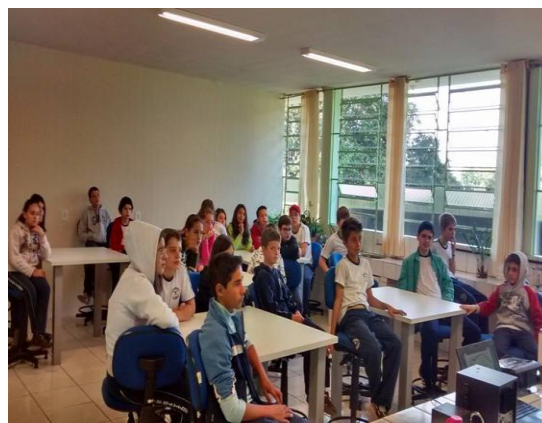
Figura 2. Alunos do 8º Ano durante a palestra do Projeto Esperança no Laboratório de Biologia, Física e Química do CEDV.