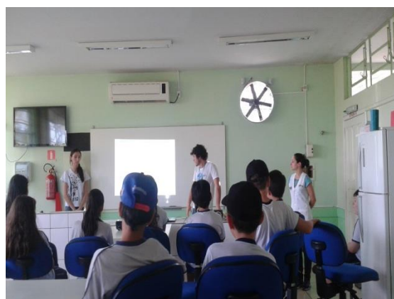
Figura 4. Pibidianos apresentando a palestra, no Laboratório de Biologia, Física e Química do CEDV.