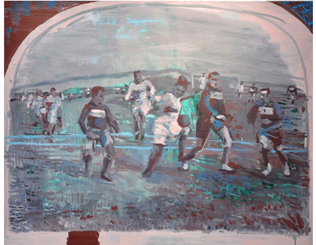
Natalia Babarovic, Fútbol , óleo sobre tela, 80 x 100 cm, 2015