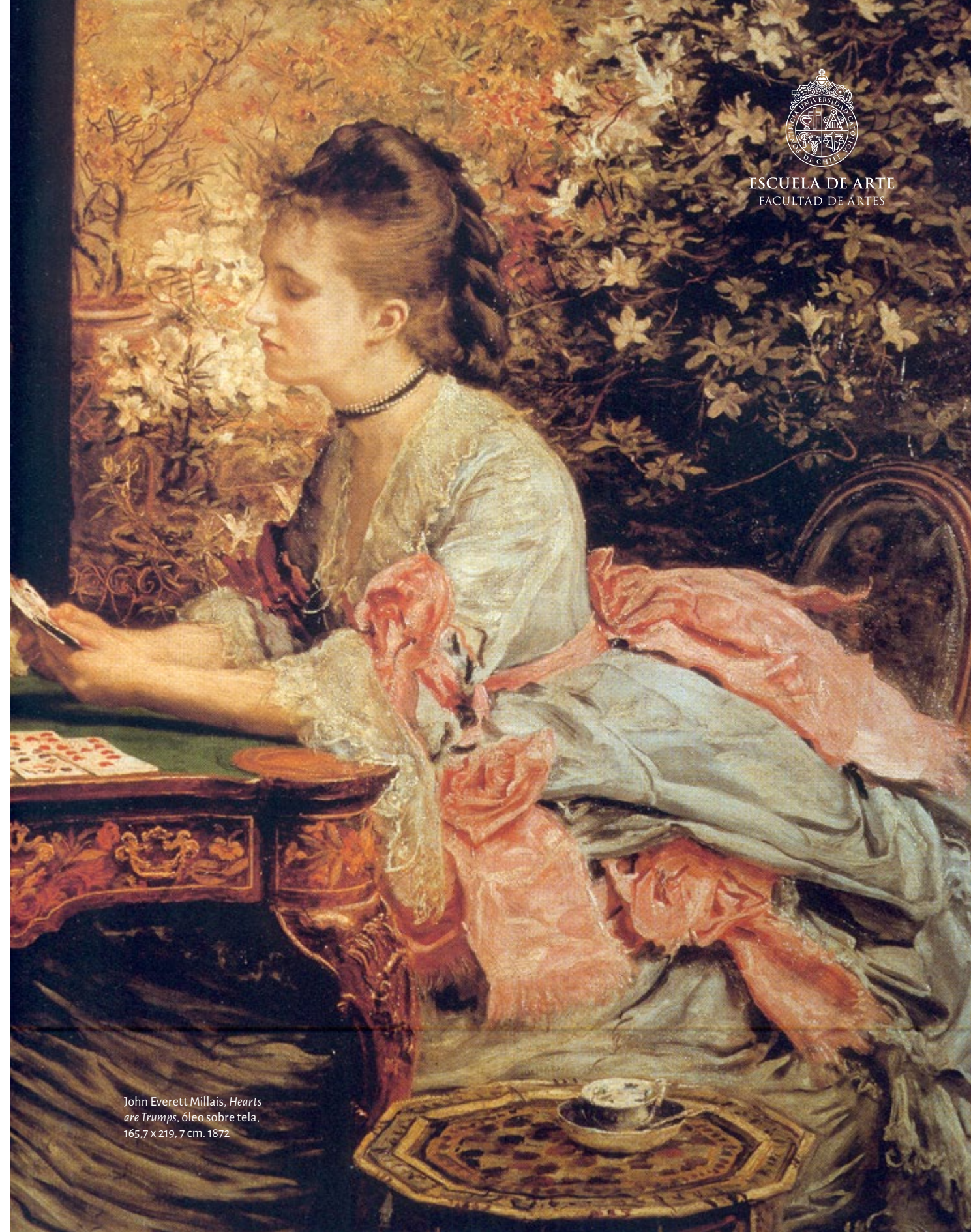
John Everett Millais, Hearts are Trumps , óleo sobre tela, 165,7 x 219,7 cm. 1872