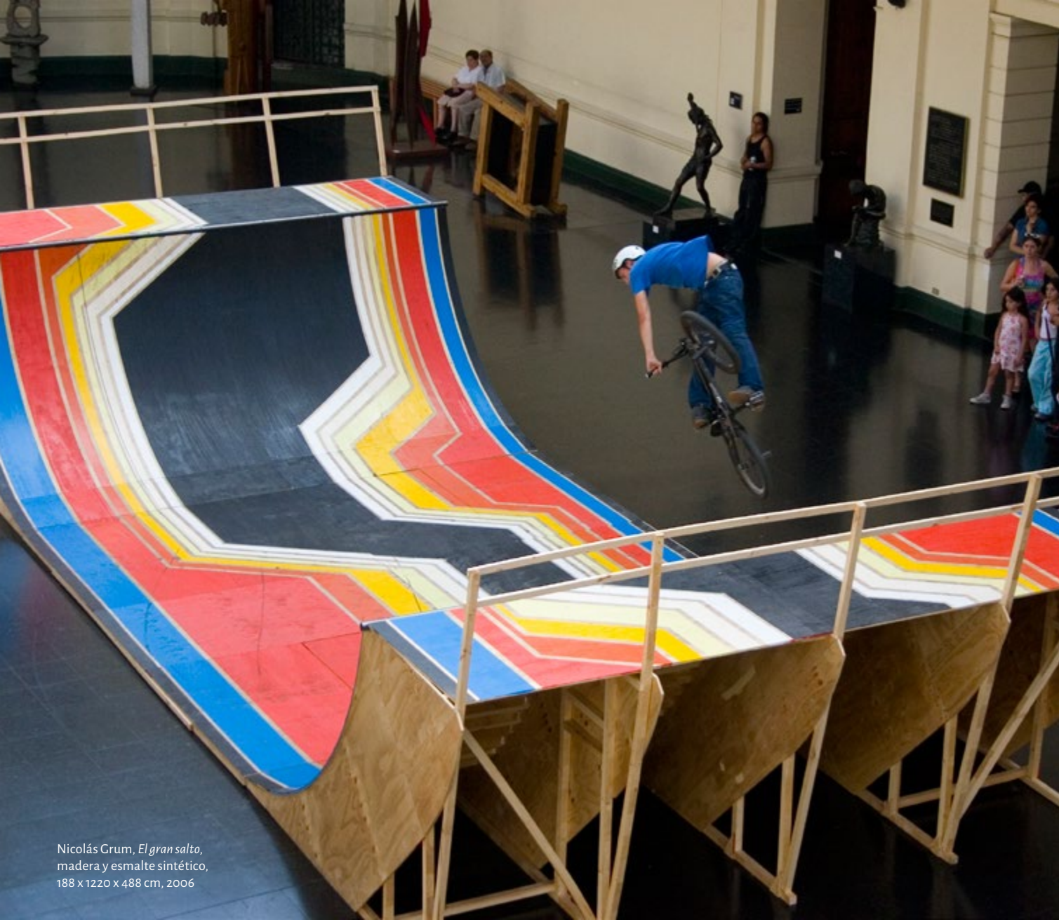
Nicolás Grum, El gran salto , madera y esmalte sintético, 188 x 1220 x 488 cm, 2006