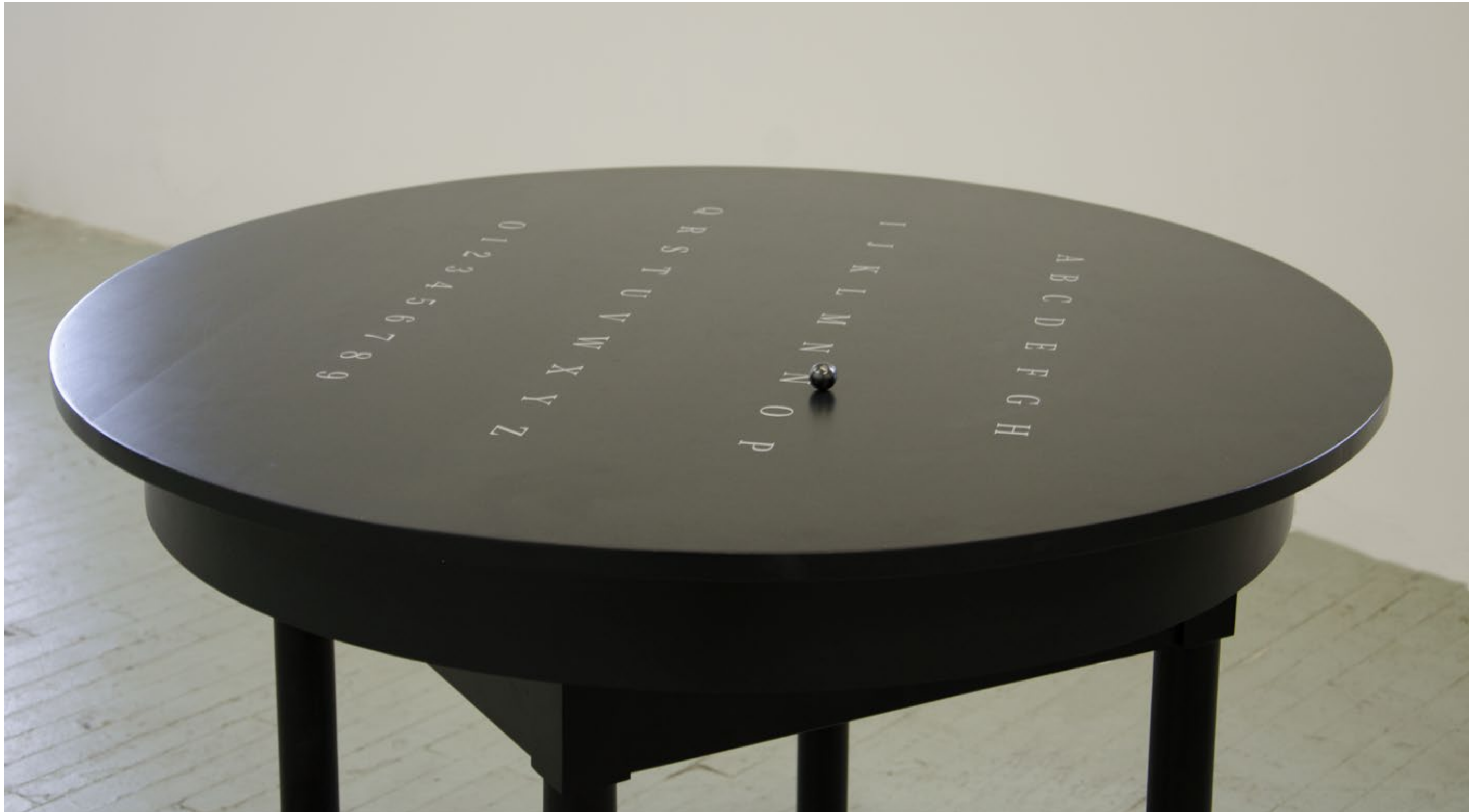
Alejandra Prieto, Tierras raras (Ouija) , Imanes, madera, arduinos, sensores, y otros, 100 x 100 x 74 cm, 2014