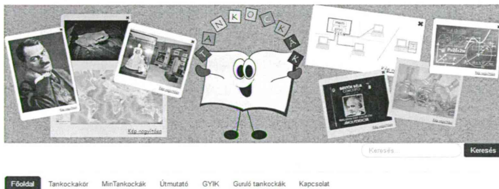
3. ábra LearningApps magyar társoldala a kockalapok.hu

2016 elejétől létrehozott társoldalunk, a kockalapok.hu segíti a pedagógusok munkáját (3. ábra).