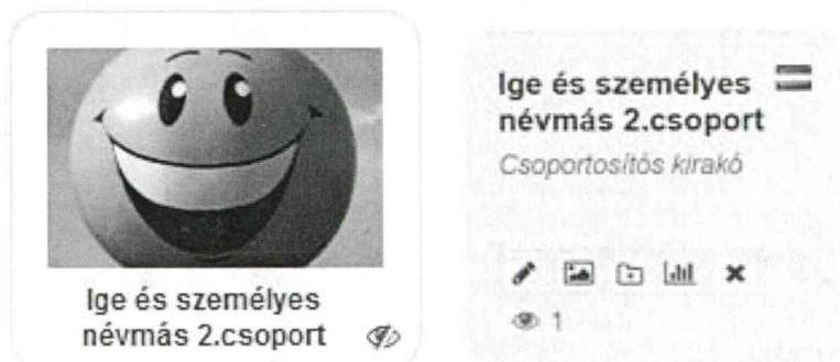
2. ábra A tankocka előnézeti képe és részletes nézete

Az oldalon való regisztráció után sablonokat használva viszonylag egyszerűen lehet applikációkat (mi tankockáknak neveztek el őket) létrehozni, azokat megosztani (2. ábra).