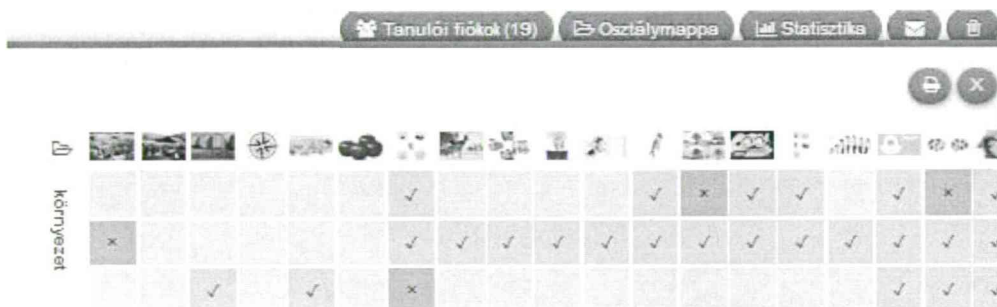
11. ábra Statistika funkció osztályon belül

Remélem, hogy kis ismertetőm után a kedves olvasó is kedvet kapott a tankockázáshoz. Keresse fel a LearningApps oldalát! Amennyiben a tankockák készítéséhez segítségre van szüksége, a kockalapok.hu-n sok hasznos információt talál. Kérdéseit felteheti, ötleteit megoszthatja a Tankockakör tagjaival a TankocKApocs elnevezésű Facebook-oldalon.