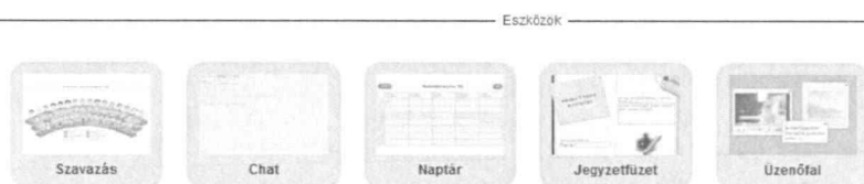
6. ábra Eszközök a felületen

Továbbá tartalmazza még a következő eszközöket: szavazás, chat, naptár, jegyzetfüzet, üzenőfal (6. ábra).