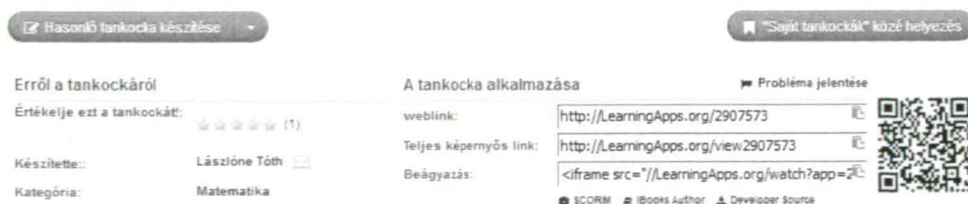
9. ábra A tankockák alkalmazása

A tankocka alatti sávokban különböző adatok jelennek meg (9. ábra). Megtalálható itt a feladat webes és teljes képernyős linkje.