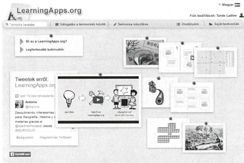
1. ábra A LearningApps főoldala bejelentkezéssel

Az oldalon való regisztráció után sablonokat használva viszonylag egyszerűen lehet applikációkat (mi tankockáknak neveztek el őket) létrehozni, azokat megosztani (2. ábra).