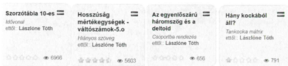
5. ábra Legkedveltebb feladattípusok

Továbbá tartalmazza még a következő eszközöket: szavazás, chat, naptár, jegyzetfüzet, üzenőfal (6. ábra).