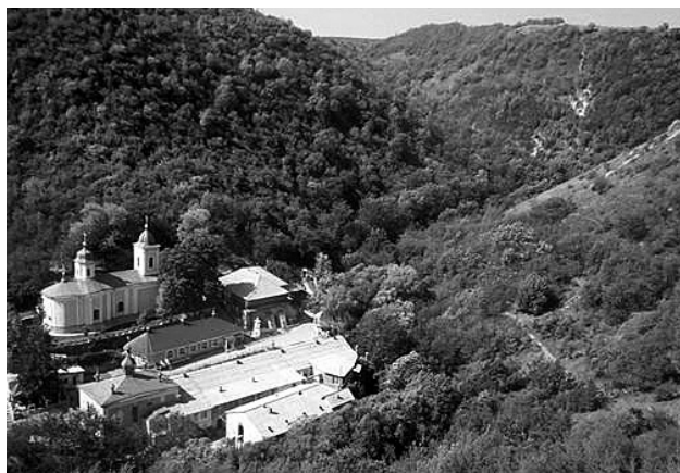
A sahornai kolostor látképe