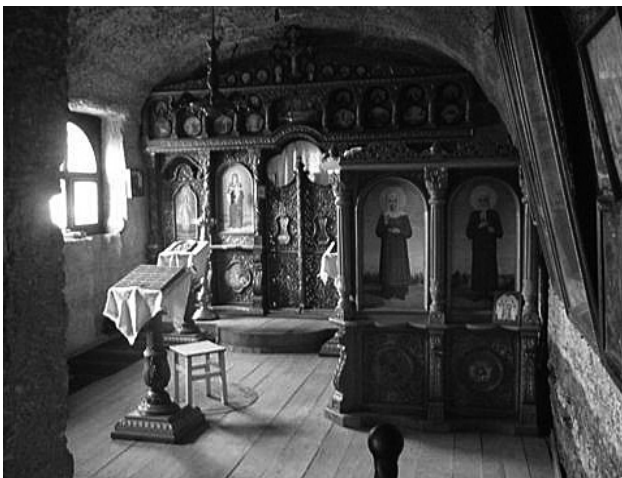
Kis kápolna a sziklába vájva