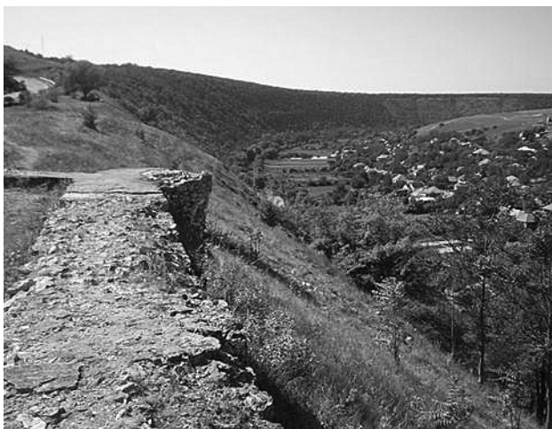
Középkori vár csekély falmaradványai a folyó felett