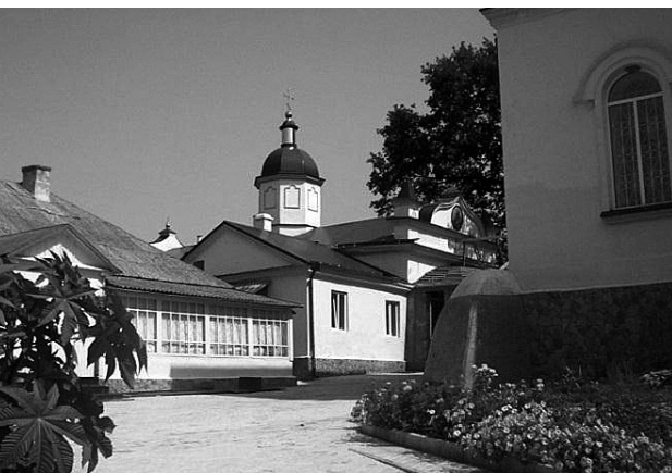
A Jabca kolostor udvara