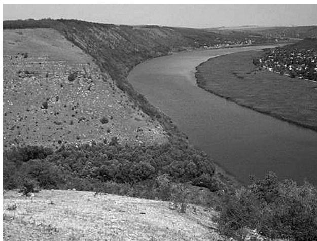
A Dnyeszter Ţipovánál