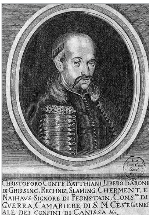
Batthyány Kristóf II. egy 1675 körül készült rézmetszeten ❖ Nemzeti Portrétár. http://www.npg.hu/index.php/component/jcollection/item/1533-batthyany-kristof-ii

Azonban, miután Kara Musztafa nagyvezír serege június 30-án megindult Székesfehérvárról Győr felé, július első napjaiban a tatár-török előhadak gyakorlatilag rázúdultak a Rába menti átkelőhelyekre. Az események rendkívüli módon felgyorsultak, a helyzet zűrzavaros voltát pedig jól tükrözi, hogy július első napjairól egymásnak ellentmondó tartalmú értesülések maradtak fenn: a Vas vármegyei alispán július 2-án még a Rábán lévő átkelők bevágásához akart sietni, 26 az idősebbik Batthyány pedig július 4-én a „jó vigyázás” szükségességét hangsúlyozta fiának, és azzal biztatta, hogy segítséget kért Lotharingiai Károly hercegtől. 27 Marsigli gróf azonban ekkor már sokkal sötétebbnek festette le a helyzetet: a magyar tisztekkel, köztük a fiatal Batthyányval való konfliktusairól írt, továbbá arról, hogy a magyarok szabadon hagyták a bodonhelyi átkelőt a tatárok számára, akik így betörhettek a Rábaközbe pusztítani. 28 Ezt követően a Rába-vonal egy-két nap alatt összeomlott. A Batthyány II. Ádám