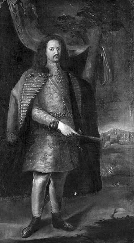
Gróf Batthyány Ádám II. (1662–1703) horvát, szlavón, dalmát bán

vezette magyar katonaság mind létszámban, mind felkészültségben esélytelen volt a támadó csapatokkal szemben. A Lotharingiai Károly által ígért segítség nem érkezett meg, sőt a herceg a Rába menti eseményekkel egyidejűleg seregét visszavonta állásaiból és megindult Bécs felé. Batthyány II. Ádám pedig, mivel nem maradt katonasága, és mert apja utasításait kellett követnie, 29 visszavonult a tűzvonalból, és a magyar történelem számára máig kínos epizód szereplőjévé vált: 1683 nyarán apjával együtt fejet hajtott az oszmán uralom előtt. 30