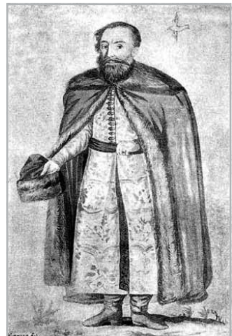
Weiss Mihály, a nagy formátumú brassói főbíró ❖ A kép forrása: Mika Sándor Weiss Mihály (1569–1612). Egy szász államférfiu a XVII. századból

Szükség is volt a szövetségesekre, mert a brassói városvezetést megosztó ellentétek országos problémákkal fonódtak össze. Báthory Gábor fejedelem 1611 decemberében elfoglalta az uralma elleni szervezkedés egyik tűzfészkeként tartott Szebent, az erdélyi szász universitas székhelyét. A szász metropoliszként is emlegetett, addig „kivülálló” számára gyakorlatilag érinthetetlen, gazdag és erős várost fejedelmi székhellyé tette, a szászok évszázados privilégiumait pedig hatályon kívül helyezte. Az erdélyi szászország történetében páratlan jogtiprás a Habsburgok erdélyi országegyesítő terveivel összefonódva szabályos polgárháborút váltott ki Erdélyben. Ez az Oszmán és a Habsburg Birodalom között öröklődő Erdélyi Fejedelemség integritását kockáztatta, 1613 őszén pedig Báthory Gábor bukásához vezetett. A harcokban kiemelkedő szerep jutott Brassónak, ami a fejedelem által kiiktatott Szeben szerepét átvéve a szász universitas vezetését vállalta magára, egyben menedéket és támogatást biztosított a Báthory hatalmával szembehelyezkedőknek. A „lázadók” célja Báthory