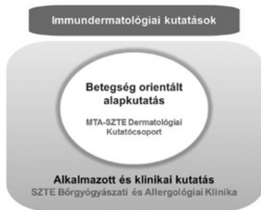
1. ábra. Az SZTE ÁOK Bőrgyógyászati és Allergológiai Klinikán folyó kutatások.