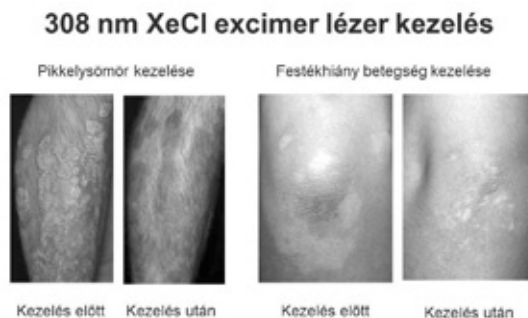
3. ábra. A 308 nm XeCl excimer lézer terápiás alkalmazási lehetőségei.

Elsőként számoltunk be arról, hogy a XeCl lézer kezelés rendkívül hatékony a vitiligo (festékihiány-betegség) kezelésében (Baltás és mtsai., 2001). Ma már a lokalizált vitiligo leghatékonyabb terápiájának tartják az általunk bevetetett XeCl lézerrel végzett kezelési eljárást. Eredményeink szerint az atopias dermatitis egyéni terápia rezisztens tüneteinek kezelésére is eredményesen használható az excimer lézer (Baltás és mtsi, 2004).