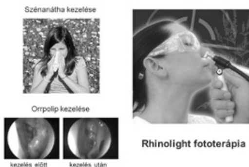
4. ábra. A fényterápia új alkalmazási lehetőségei.

Túlzás nélkül állítható, hogy a bőrgyógyászati fényterápiában az elmúlt 20 év legnagyobb áttörését az általunk kifejlesztett célzott UV-B fényterápiás készülékek bevezetése jelentette. Ezen innovatív orvostechikai eszközök segítségével flexibilis száloptikán keresztül nagy energiájú koherens (lézer) vagy inkoherens UV-B fény juttatható a kezelni kívánt bőrterületre. A léziók célzott kezelése révén a környező ép bőrterületet nem éri az esetlegesen károsító sugárzás. Emellett a pikkelysömörös lézióknak megfelelően kiszélesedett hámterületeken nagyobb – a MED többszörösének megfelelő – UV-B dózis alkalmazható, mint a környező ép bőrterületen, így gyorsabban érhető el a tünetmentesség. A XeCl lézer optikai tulajdonságainak (308 nm-es, nagyenergiájú, monokromatikus, koherens UV-B fény emissziója), valamint a száloptikán alapuló fénytovábbító rendszernek az ötvözésével olyan berendezés született, amellyel különböző bőrbetegségekben eredményesen végezhető lokális UV-B fénykezelés. A célzott fototerápiával megvalósítható olyan testtájak – például a hajás fejbőr vagy a száj- és az orrnyálkahártya – kezelése is, melyek a hagyományos fluoreszkáló fényforrással rendelkező berendezésekkel nem érhetők el, ami egyúttal a fototerápia indikációs körének bővüléséhez vezethet.