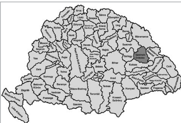
A MEGYE HELYE A TÖRTÉNELMI ÁLLAM TERÜLETÉN