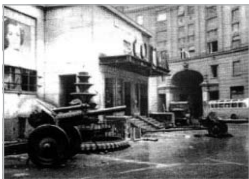
A CORVIN KÖZ 1956-BAN

Mind a két bátyámnak volt már fegyvere akkor, csak nekem nem. Amikor jöttünk be gyalog Erzsébetről, és megláttam egy fegyverest, mindig kértem, hogy adja nekem a fegyverét. De senki nem akarta nekem adni. Aztán a Boráros téren voltunk, amikor egy olyan 30-35 éves ember azt mondta, hogy fiúk, én hazamegyek aludni, a puskámnak