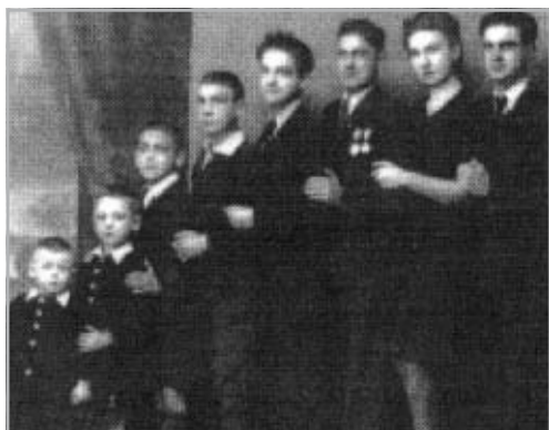
A PONGRÁTZ TESTVÉREK 1942-BEN

végig, 19 kiküldetést kapott, és 1941-ben vitézzé avatták, azért 1941-ben, mert jött a román megszállás. Állam és jogtudományi doktor volt, de soha nem tette le az esküt a román államnak, úgyhogy a diplomáját soha nem használta. Foglalkozott mindennel. 9-en voltunk testvérek, 7-en voltunk Magyarországon a forradalom idején, és 6-an voltunk ott a forradalomban. A 12 éves hűgom maradt otthon édesanyámmal, a többiek mind benne voltak. Úgy alakult a helyzet, hogy nemcsak, hogy benne voltunk, hanem egész komoly szerepet játszottunk a testvéreimmal a forradalom idején.