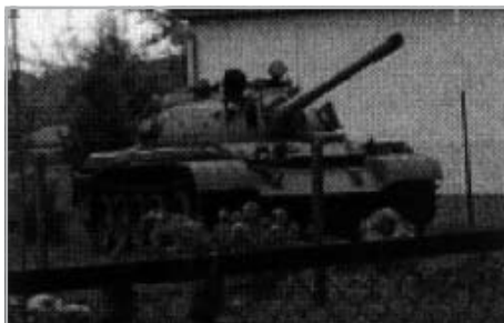
KIÁLLÍTOTT SZOVJET TANK KISKUNMAJSÁN

magyar kormány, hanem a csehszlovák, a lengyel és az orosz kormány is a pesti srácoknak köszönhetik, hogy uralmon vannak. És itt is vagy hat pontot mondtam el. És mit kaptak ezért a pesti srácok? Azt, hogy most is 5-6000 Ft nyugdíjból