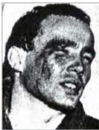
A „BLOOD BATH” ÁLDOZATA

egyik felében meredek lelátó, a másik felében az öltözők és a kiúszó volt. Zsúfolóság tele volt, és legalább annyian rekedtek kint az uszoda előtt, felcsigázott érdeklődés vette körül a meccset. Mi úgy álltunk hozzá, hogy nem jöhetünk ki vesztesen a vízből. Noha a szovjet csapat tagjait jól ismertük, és nem volt különösebb bajunk velük, de a melegítőjükre ugyanaz a négy betű, CCCP volt ráírva, mint amik a szabadságharcot elnyomó tankokra.