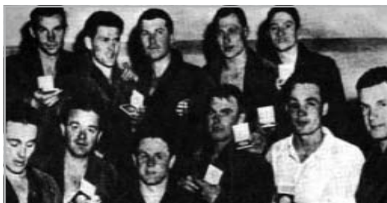
AZ OLIMPIAI GYŐZTES CSAPAT

olimpiát megnyertük, még együtt örültünk aztán másnapra szétszéledt a társaság.