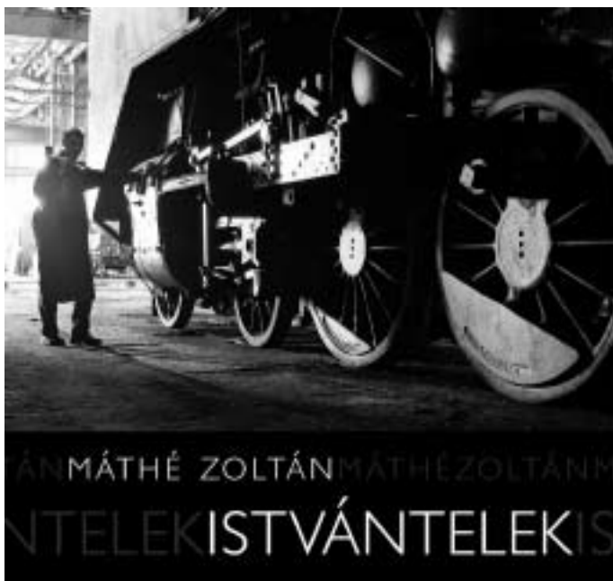
A FOTÓALBUM MAGYARORSZÁG ELSŐ ÉS UTOLSÓ GŐZMOZDONYJAVÍTÓ-MŰHELYÉNEK, AZ ISTVÁNTELEKI JÁRMŰJAVÍTÓNAK A MINDENNAPIAIBA NYÚJT BEPILLANTÁST. A MŰVÉSZI KÉPEKET MAGYAR ÉS ANGOL NYELVŰ KÍSÉRŐSZÖVEG EGÉSZÍTI KI.