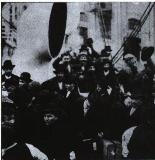
Kivándorlók a fedélzeten

Az 1870-es, 80-as években még jó kereseti lehetőségeket kínált Amerikában, az 1890-es években azonban ott is telítődött a munkaerőpiac. Amerika nem tudta felszívni maradéktalanul a beáramló embertömegeket. A bevándorlókkal rendszerint a legnehezebb fizikai munkákat végeztették, részük bányatelepekre, gyárakba, kohóüzemekbe került rossz egészségügyi viszonyok közé. Ebben persze az is közre játszott, hogy a kivándorlók 70-80 %-a tanulatlan paraszt vagy ipari munkás volt,