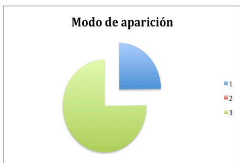
Fig.1. Modo de aparición de "sistema"

En las siguientes 4 ilustraciones podemos observar de manera gráfica los resultados obtenidos del análisis del currículo: