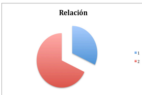
Fig.2. Relación de los conceptos entre sí.