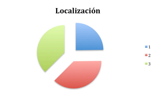
Fig.3 Localización de la palabra "sistema".