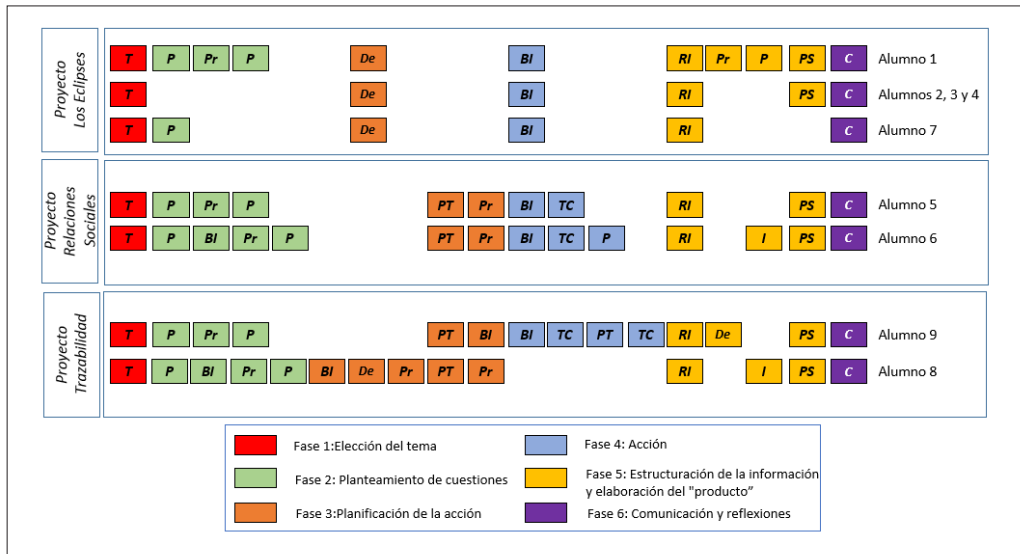
Fig. 3. Acciones declaradas por cada estudiante en cada fase.

enfoque global, las estudiantes de este proyecto van más allá de la búsqueda de información, siendo una acción que emplean para focalizar las cuestiones y recopilar información a través de entrevistas y cuestionarios para dar respuesta a dichas preguntas.