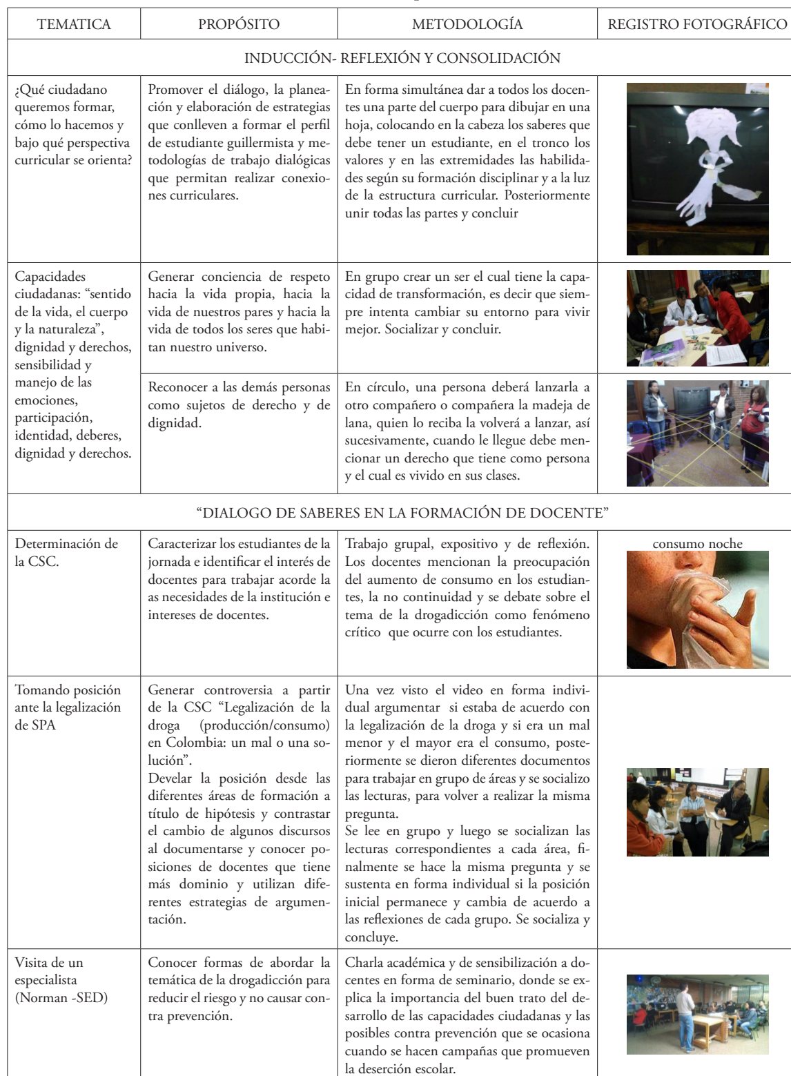
Tabla 1. Sistematización de actividades realizadas producto de análisis textual discursivo