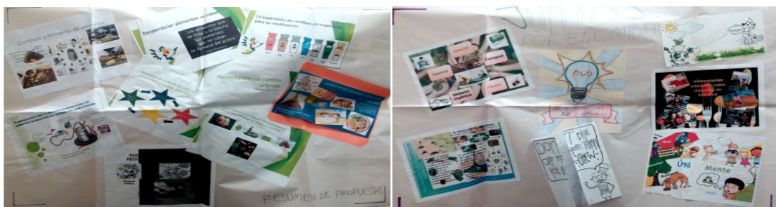
Fig. 3 y 4. Algunos collages elaborados por los grupos de estudiantes.

Luego de la exposición de argumentos sobre las propuestas, se procedió a la etapa de demonstración , aquí se buscó que el estudiante hiciera evidentes sus desempeños y que el docente pudiera observar como ellos ponen en práctica lo aprendido dentro de un contexto determinado, entonces, se solicitó condensar cada propuesta en una diapositiva que debió llevarse impresa al escenario de clase y con estas elaboraron un collage en grupos de trabajo. Las imágenes 3 y 4 ilustran algunos collages elaborados.