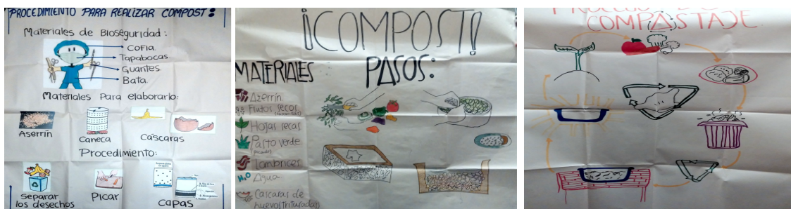
Fig. 5, 6, 7. Diseño de propuestas para la elaboración de compostaje elaboradas por los estudiantes.

Finalmente, la actividad de cierre es un momento de consolidación de las enseñanzas en donde se formulan las conclusiones y recomendaciones del proceso, es aquí cuando se consolida el aprendizaje. Para ello, nuevamente se desarrolla trabajo en grupos, donde se solicita a los estudiantes elaborar una cartelera en la cual expongan el posible procedimiento a seguir para elaborar compostaje con los residuos sólidos orgánicos provenientes de sus hogares. A continuación en las figuras 5 a 7, se presentan algunas de estas propuestas.