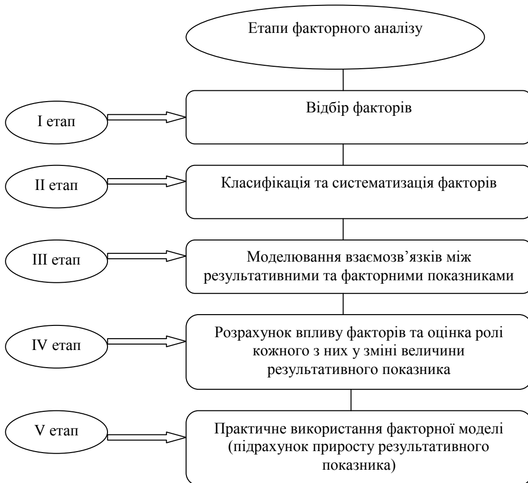
Рис. 1. Етапи факторного аналізу

Факторний аналіз складається з певних етапів, які наведено на рис. 1.