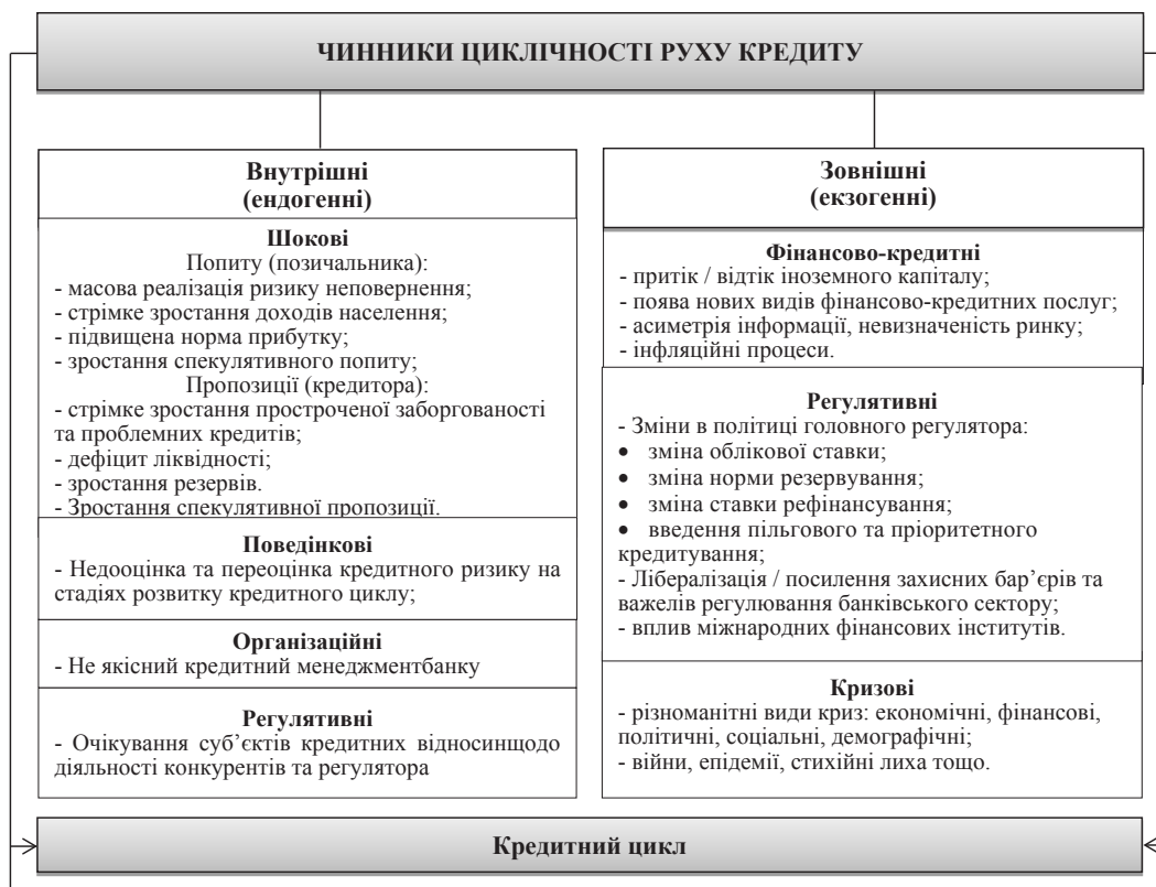
Рис. 1. Групи чинників циклічності руху кредиту

На думку Д. Буракова, природа циклічності руху кредиту є гетерогенною, або різнорідною. У своїх дослідженнях він стверджує, що в деяких випадках кредит має значний вплив на формування самих коливань, а в інших його вплив є несуттєвим. В одних умовах відповідальними за реалізацію кредитного ризику цілком і повністю є кредитори і регулятори, в інших – позичальники, тому що для банківських інститутів така сукупність ризикового навантаження є абсолютно непередбачуваною [4, с. 69].