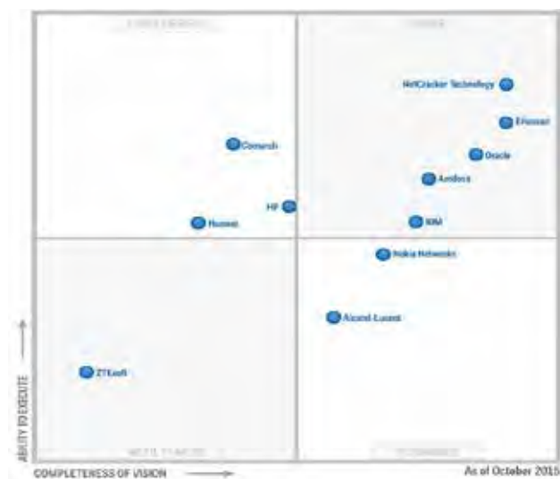
Рис. 1. «Магічний квадрант» OSS-систем [5]

Кожного року компанія Gartner, що займається консалтингом і дослідженнями винятково