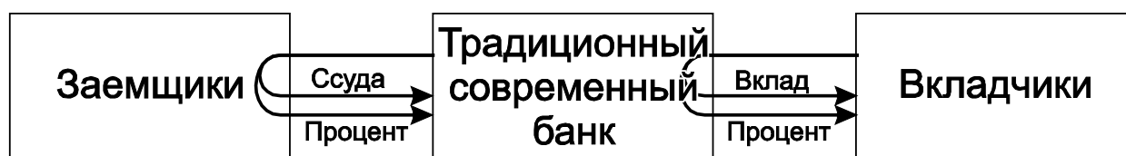
Рис.1. Схема кредитного посредничества современного традиционного банка

Говоря о парадигме традиционного современного банка, нельзя не сказать о том, что сегодня такой банк практически всю свою деятельность основывает на кредите (как экономических отношениях по поводу возвратного движения ссуженной стоимости) и, соответственно, создает, концентрирует и размещает ссудный капитал, как денежный капитал, приносящий процент, функционируя в качестве кредитного посредника денежного рынка, что наглядно видно на рис.1.