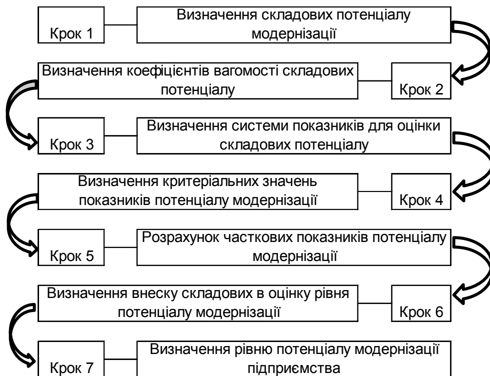
Рис. 2. Послідовність здійснення бальної оцінки потенціалу модернізації підприємства

Нами була здійснена бальна оцінка модернізаційного потенціалу переробного підприємства, відповідний потенціал якого включає п'ять складових (див. табл. 1). Було визначено, що технологічна складова у нього є профілюючою, і коефіцієнт її вагомості оцінений на рівні 0,25. За таких умов визначилися границі рівня модернізаційного потенціалу підприємства у розрізі його складових, які наведені у таблиці 1.