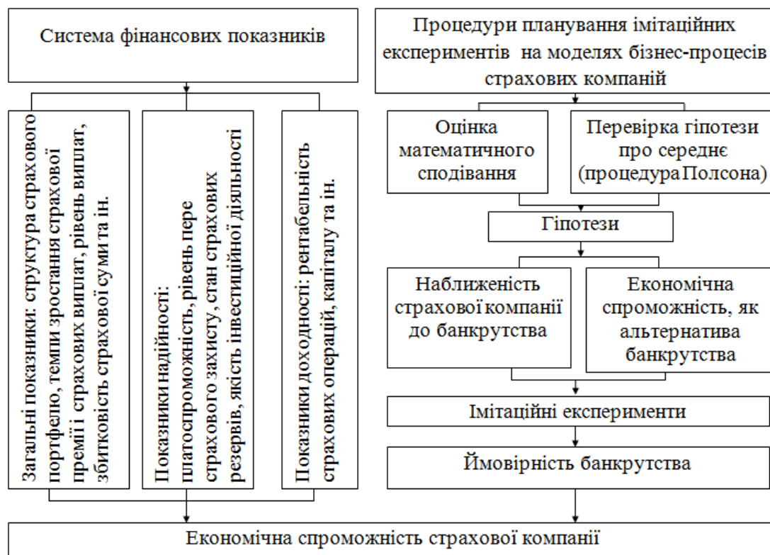
Рис. 2. Система показників оцінки фінансового стану страхової компанії

Усі наведені показники розраховуються на базі імітаційної моделі у блоці «Фінансова діяльність та економічна спроможність» (рис. 3).