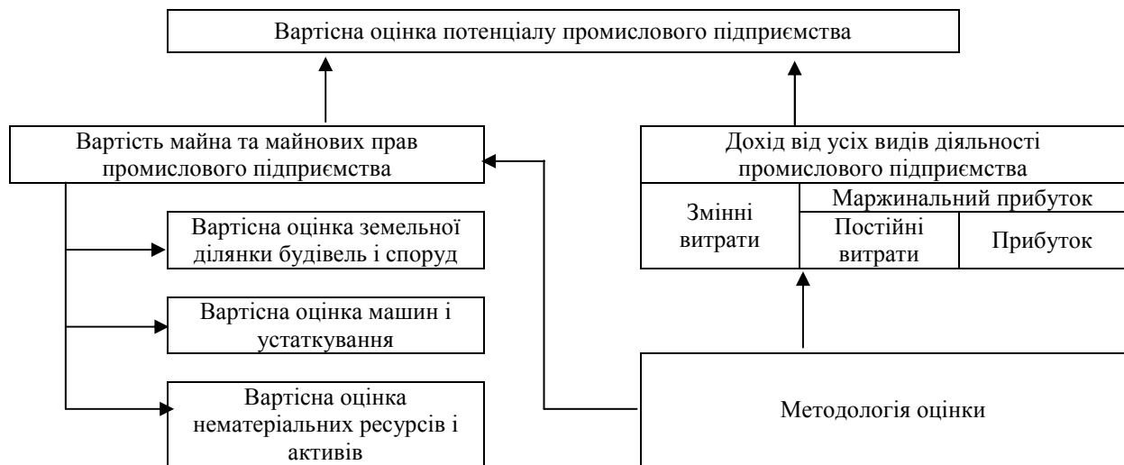
Рис. 3. Алгоритм раціональної організації вартісної оцінки потенціалу промислового підприємства.

Переосмислення механізмів управління планування та організації виробництва в ринкових умовах вимагає звернути увагу на промислових підприємствах до вартісної оцінки майна, майнових прав, доходів від усіх видів діяльності з використанням системи нормативних методів та сукупності відповідних норм і нормативів використання ресурсів.