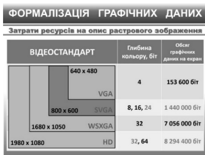
Рис.7. Затрата ресурсов на описание растровых изображений