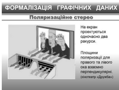
Рис.10. Поляризационное стерео

Наглядная подача учебного материала с актуализацией знаний в области физики не только углубляет информационные компетентности будущих учителей физики, математики и информатики, но и способствует увеличению мотивации учиться самому и учить других.