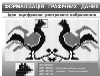
Рис.5. Идея оцифровки растрового изображения