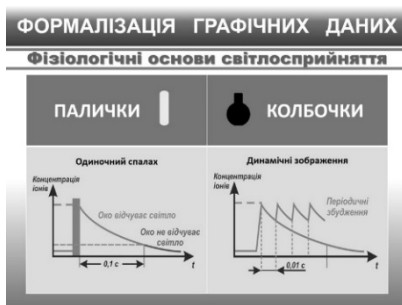
Рис.6. Физиологические основы световосприимчивости