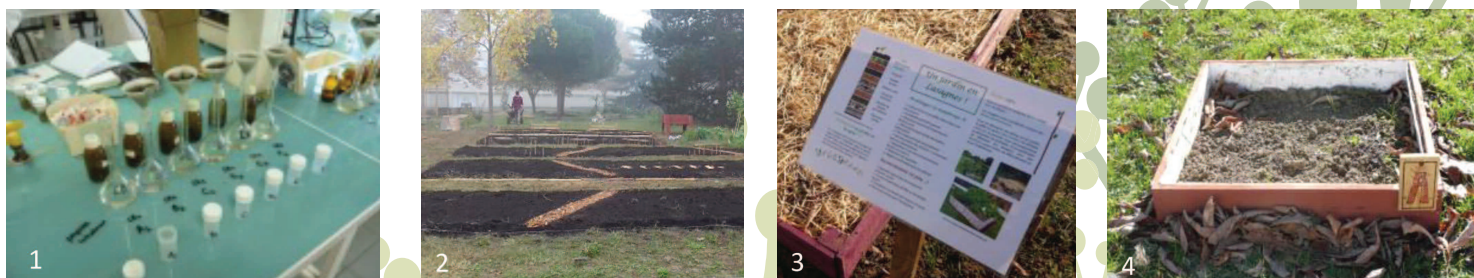
Figure 4 : Les axes de travail du projet tutoré « Urba Green » : 1- Documenter les caractéristiques du sol, avec des méthodes simples et peu coûteuses. 2- Créer des supports pédagogiques et partager des savoirs agronomiques. 3- Aménager la partie collective du jardin du Mini M. 4- Créer des parcelles expérimentales pédagogiques.

• « Urba Green » a développé une animation autour d'une meilleure connaissance de l'écosystème sol, d'un projet d'aménagement de la partie collective du jardin et d'une pédagogie des pratiques agroécologiques (Figure 4).