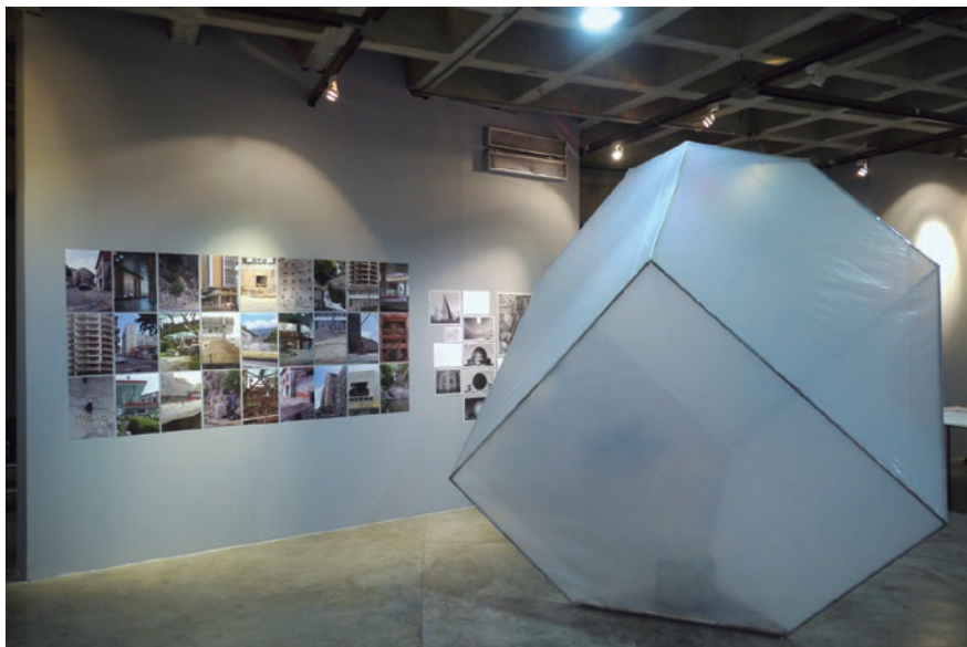
FIGURA 7. Vista de sala con la obra en maqueta y las imágenes de referencia.

Con más razón, entonces, es necesario indagar en las obras expuestas en Helicoides posibles para ver si ceden a ese impulso nostálgico que Olalquiaga advierte, o si encuentran otras vías para representar la ruina. La premisa especulativa (en lugar de conmemorativa) de las obras comisio-nadas prefiguró El Helicoide como una zona de contacto entre contexto, cuerpo social y entorno arruinado, a partir de la que los artistas ensayaron nuevos usos para el edificio.