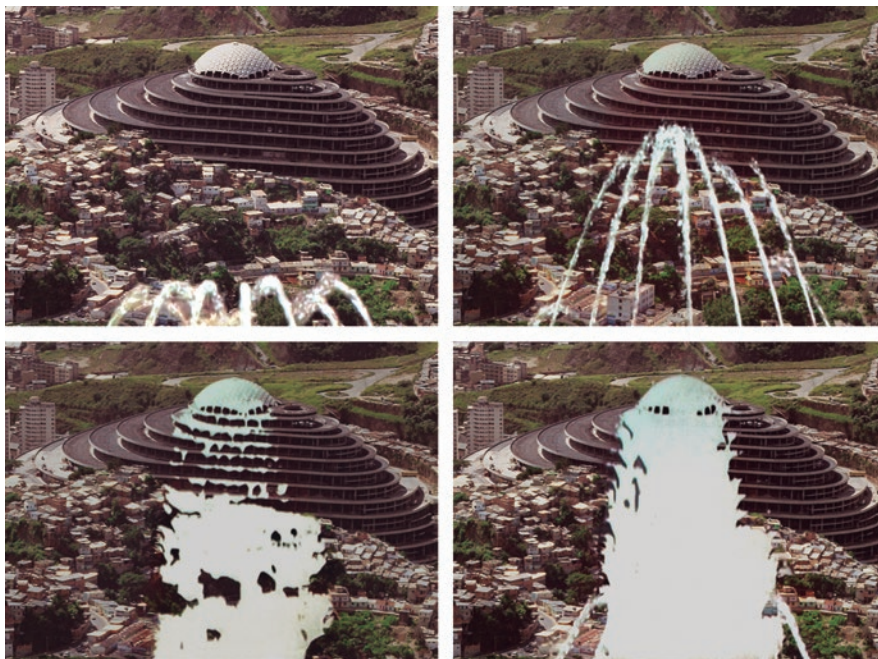
FIGURA 2. Alexander Apóstol, El Helicoide , de la serie Caracas Suite (2003), 5:30 min.

desde el video y la fotografía, hasta el dibujo y el collage. En la discusión que sigue estudiaré tres obras producidas entre 1998 y 2014, para identificar cómo superan la representación nostálgica o romantizada de El Helicoide, y cómo abordan la ruina para indagar en realidades más amplias y así repensar la monumentalidad.