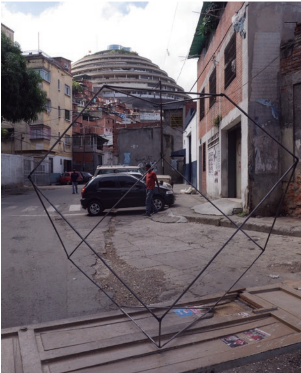
FIGURAS 5 Y 6. Diseño del hipotético monumento; intervención in situ frente a El Helicoide.