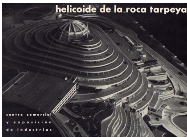
FIGURA 1. Maqueta de El Helicoide , fotografía anónima. Archivo de Fotografía Urbana/ PROYECTO HELICOIDE (s/f).

Con su diseño audaz, carga simbólica y tumultuosa historia, El Helicoide es una presencia fascinante en el paisaje urbano y el imaginario colectivo. Esto, aunado a los continuos intentos por darle un significado cohesivo, ayuda a explicar por qué tantos artistas venezolanos lo han representado en diferentes medios,