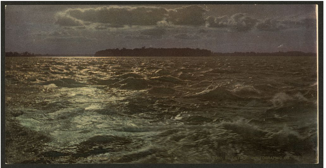
Säätö-yhteiskunnan mureneminen huipentui maailmankatsomukselliseen vellontaan, jota Jutikkalan tutkimuksissa seurasi taloudellisesti dynaaminen ja aikaisempaa inhimillisempi porvarillinen yhteiskunta. Kuva: Coteau Rapids, St. Lawrence River, ca. 1890.

Säätö-yhteiskuntaa on totuttu pitämään kaavoihinsa kangistuneena. Siinä on kuitenkin alituista liikeyä, kuten meressä, ja merta se muistuttaa siinäkin, että aivan kuten vesimassojen pohjakeroiset syksyllä jatkavat lämpenemistään pintakerrosten jo jäähtyessä, samoin säätö-yhteiskunnan alimmat portaat vakintuivat silloin kun sen ylimmät jo murenevät. [102]