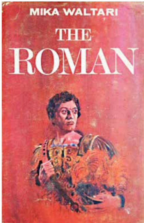
KUVA 1. Mika Waltarin romaani Ihmiskunnan viholliset (WSOY 1964) käännettiin monille kielille, englanniksi nimellä The Roman (Hodder & Stoughton 1966).

Allergia- ja astmalaiton neuvojilta kysytään eniten eläinallergioista, ja ihmisten mielipiteet voivat olla jyrkkiä. Koirille ja kissoille tappotuomio, ne ovat ongelmien alku ja juuri! Ei suinkaan, ne ovat välttämättömiä ihmisten hyvinvoinnille, lemmikit pitävät isäntänsä terveempänä ja pidentävät ikää. Monen nykyaikaisen immunologin toleranssi on kehittynyt vajaasti, mikä altistaa ihon ja limakalvot allergiselle tulehdukselle. Kansallinen allergiaohjelma on kääntänyt välttämistä strategiaa sietostrategiaksi. Se koskee myös eläimiä. Niitä ei tarvitse välttää imeväisiässä. Varhaislapsuuden eläinallergiat pikemminkin suojaavat allergioiden kehittymiseltä. Lemmikkieläinten allergeeneja on pieniä määriä joka paikassa, ei vain siellä, missä eläimet asustavat. Yleisiä välttämishojeita ei ole. Ohjeiden pitää olla yksilöllisiä ja koskea vain voimakkaasti oireilevia, joita saattavat tulevaisuudessa auttaa uudet siedätyshoidon muodot.