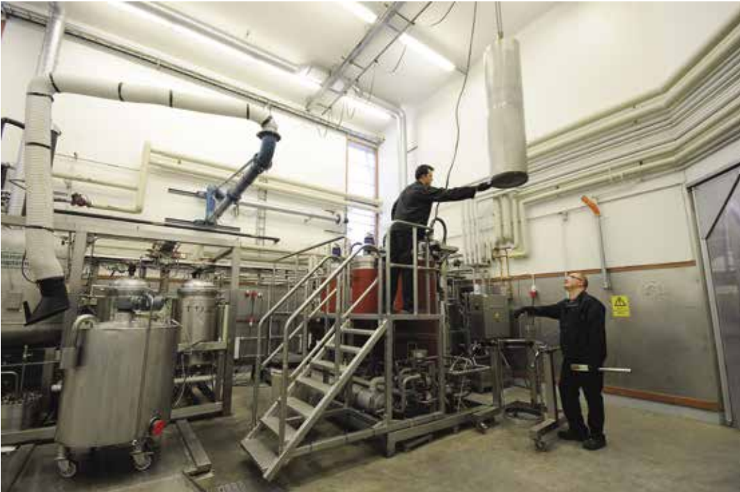
Kuva 5. Uttoprosessi on yleisimmin käytettyjä luonnontuotteiden vaikuttavien aineiden erotusmenetelmiä. Kuvan hiilidioksidiuuttolaitteilla erotetaan marjojen siemenistä arvokkaita öljyjä.

Luonnontuotealan kasvuun ja kannattavuuteen voidaan vaikuttaa hyödyntämällä olemassa olevaa tekniikkaa sekä uutta kehittämällä. Vaikuttavien aineiden erottamiseen liittyvää teknologiaa on jo jonkin verran käytössä, mutta kansainvälisestikin tarkasteltuna edelleen tarvittaisiin lisäpanostusta arvoaineiden talteenottoon ja jatkojalostukseen.