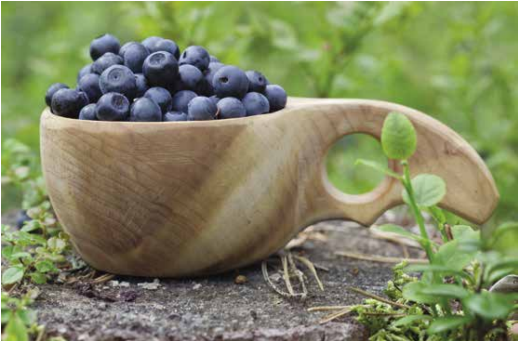
Kuva 1. Metsämustikka on kaupallisesti merkittävä ja kansainvälisesti varsin tunnettu marja, jolle on elintarvikekäytön lisäksi suurta kysyntää erityisesti Japanissa silmänhoitotuotteeksi jalostettuna.

Luonnonsienten kaupallinen keruu painottuu vahvasti Itä-Suomeen. Sienilajeista kaupallisesti selkeästi tärkein on pääosin vientiin menevä herkkutatti, muita merkittäviä sieniä ovat rouskut, keltavahvero, suppilovahvero ja korvasieni. Vuosittaiset satovaihtelut ovat sienillä erittäin suuria. Vuosina