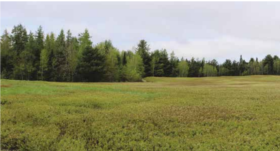
Kuva 4. Pohjois-Amerikassa marjantuotantoa on laajennettu viljelyn avulla. Kuvan kanadanmustikkakenttä Mainessa on perustettu metsänpohjan luontaisesta kasvustosta. Toistaiseksi viljellyt marjat ovat pitkälti kilpailleet samoilla maailmanmarkkinoilla metsämarjojen kanssa.