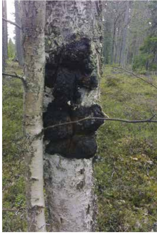
Kuva 3. Pakuria voidaan maanomistajan luvalla kerätä metsistä, mutta pakuria puoliviljelemällä vajaatuottoisista koivikoista voidaan saada uudentyyppisiä tuloja.

Luonnosta peräisin olevia kasveja viljelemällä voidaan varmistaa luonnontuotteiden saatavuutta, tasoittaa ja parantaa raaka-aineiden laatua, lisätä tuotantomääriä sekä saada tuotantoon kasveja, jotka eivät kestä kaupallista keruuta tai joiden keruu luonnosta ei olisi taloudellisesti kannattavaa. Kansainvälisesti kaupallinen yrttituotanto perustuu pääosin viljelyyn. Luonnonyrttien erikoiskasviviljelyn lisäksi on käynnistetty luonnonmarjojen viljelyä. Esimerkiksi karpalon ja puolukan viljely on Pohjois-Amerikassa laajamittaista, mutta Suomessa luonnontuotteiden viljelytuotanto on vielä varsin kokeiluluonteista. Ulkomailla myös luonnonsieniä on viljelty onnistuneesti.