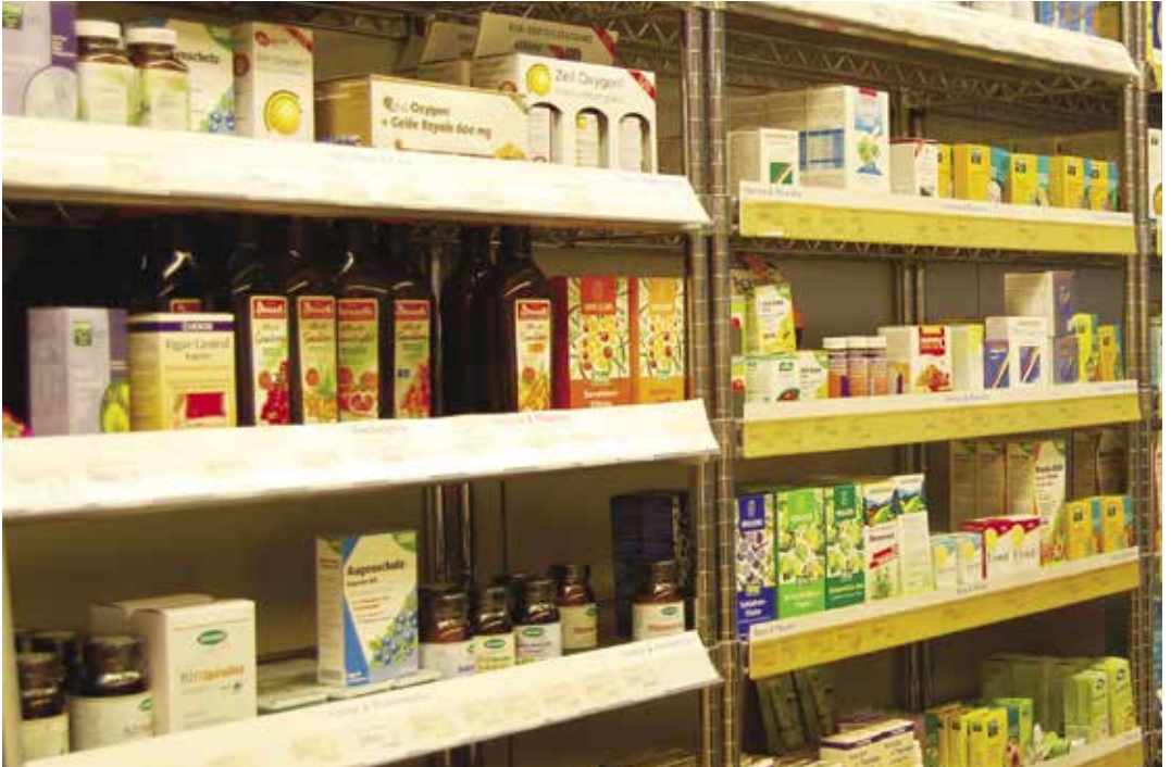
Kuva 6. Luonnonkosmetiikan ja lisäravinteiden markkinat kasvavat kansainvälisesti. Erilaisten luonnontuotepohjaisten hyvinvointituotteiden kehittäminen tarjoaa mahdollisuuksia yritystoimintaan.

Lähiiruokatreendi, ekologisuus ja terveellisyys lisäävät luonnontuotteiden käyttöä vetovoimatekijänä matkailuun liittyvissä ruoka- ja ohjelmapalveluissa. Kokonaisuutena voidaan täydentää luonnontuotepohjaisella viherrakentamisella ja -sisustamisella sekä floristiikalla. Matkailu- ja hyvinvointipalveluissa tutuiksi tulleet tuotteet sopivat usein myös matkamuistoiksi.