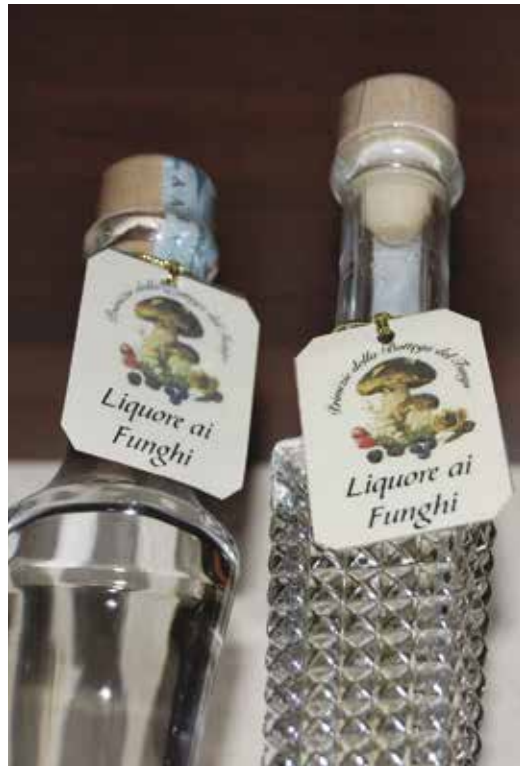
Kuva 2. Italiassa herkkutatilla on arvostettu sieni, jonka tuotteistaminen on monipuolista ja pitkälle vietyä. Suomesta sienet lähtevät maailmalle jalostamattomina.