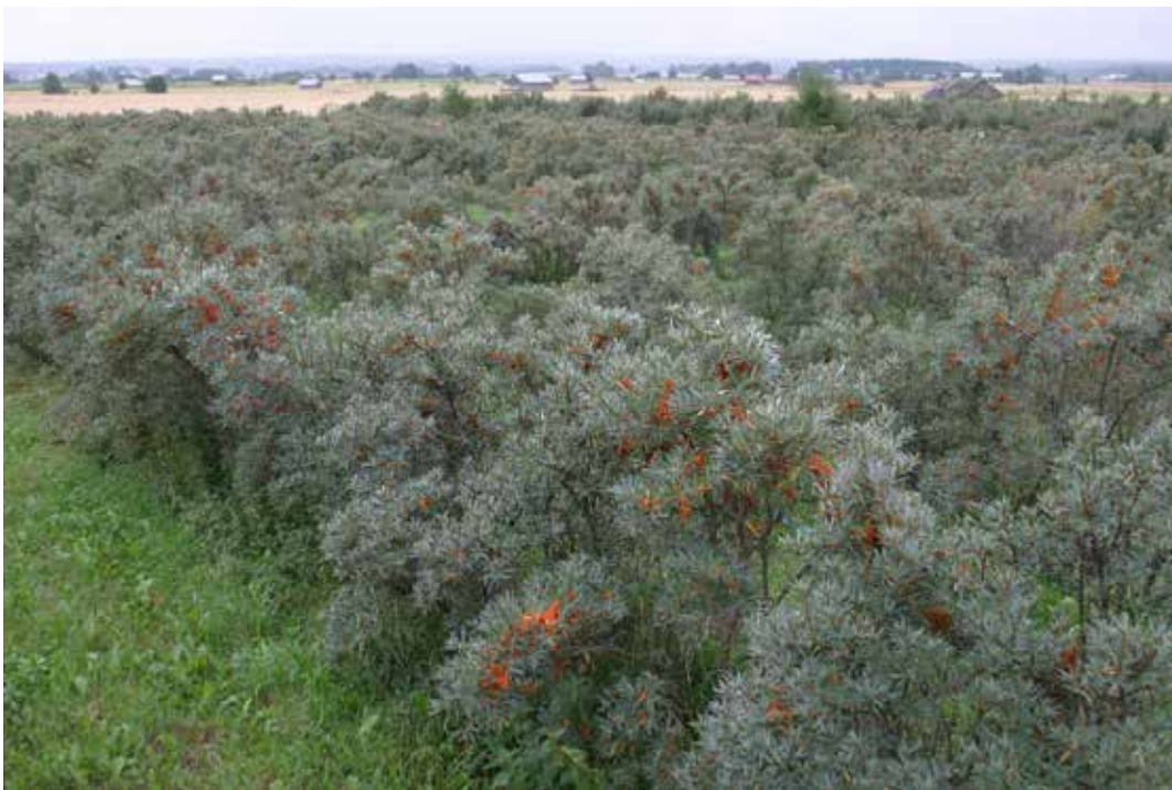
Kuva 1. Tyrniviljelmä Etelä-Pohjanmaalla.

MARSI-tilastojen Länsi-Suomen suuraluetta koskevien tietojen mukaan arvioituna puolukkaa ja mustikkaa maakunnassa kerätään kohtuullisen paljon myyntiin, karpaloa hieman, mutta muita luonnontuotteita ei juuri lainkaan (Marsi 2013). Marjoja kerätään myös kotitalouskäyttöön, sieniä selvästi harvemmin. Luonnonsienten satomäärää Etelä-Pohjanmaalla alentaa soiden ja karuhkojen kasvupaikkojen runsaus. Sama tilanne koskee luonnonyrttejä, joskin joidenkin lajien paikallisilla esiintymillä saattaa olla taloudellista merkitystä. Kasvistoa ei ole tiettävästi luonnontuotekäyttöä ajatellen inventoitu. Merkittävä osa luonnontuotevaroista jää kuitenkin hyödyntämättä.