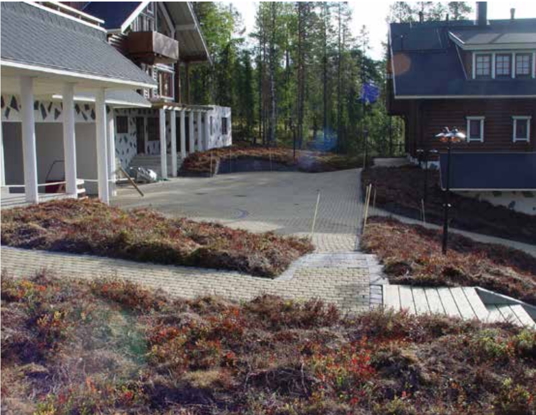
Kuva 2. Metsän kunta tarjoaa mahdollisuuksia luonnonmukaiseen viherrakentamiseen ja matkailuympäristöjen kehittämiseen.

Etelä-Pohjanmaalla toimii runsaasti tutkimukseen, koulutukseen, kehittämistyöhön tai yritysneuvontaan liittyviä organisaatiota, joilla on tunnistettu mahdollisia liittymäkohtia luonnontuotealan edistämiseen. Suoranaista luonnontuotealan toimintaa tai osaamista maakunnassa on kuitenkin melko vähän, mutta alalla hyödynnettävissä olevaa taustaosaa on monipuolisesti. Keskeisimmät toimijatahot on listattu taulukossa 1 ja kuvattu pääpiirteittäin tässä luvussa luonnontuotealaan liittyviä asioita poimien. Tarkemmin organisaatioista on koottu tietoja liitteeseen 2.