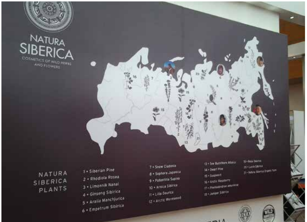
Kuva 2. Natura Siberican osasto Biofach 2013 -messuilla Saksan Nürnbergissä.