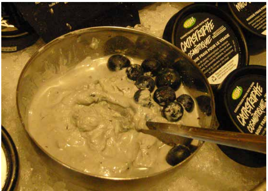
Kuva 3. Pensasmustikkanaamio Lush-ketjun myymälässä.