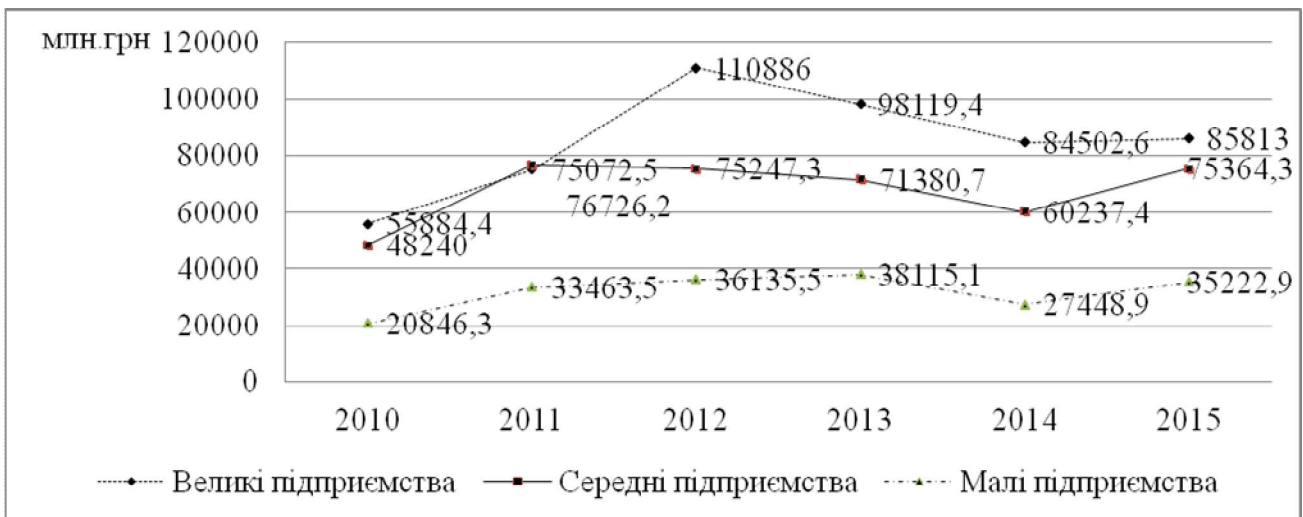
Рис. 2. Динаміка капітальних інвестицій підприємств за їх розмірами за період 2010-2015 років

У 2015 р. малими і середніми підприємствами було залучено 110587,2 млн. грн. капітальних інвестицій, з яких 75364,3 млн. грн. - середніми підприємствами та 35222,9 млн. грн. - малими. У порівнянні з 2010 р., обсяг залучених капітальних інвестицій збільшився на 41 500,9 млн. грн. У 2015 р. відбулися зміни у структурі залучення капітальних інвестицій за рахунок збільшення інвестицій у середні та малі підприємства. Так, 43,7% капітальних інвестицій було спрямовано у великі підприємства, 38,4 % - у середні підприємства та 17,9% - у малі підприємства.