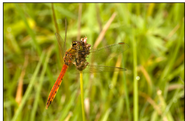
Foto: mannetje Kempense heidelibel.