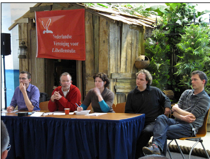
Foto 1: bestuur van de Nederlandse Vereniging voor Libellenstudie, anno 2010.