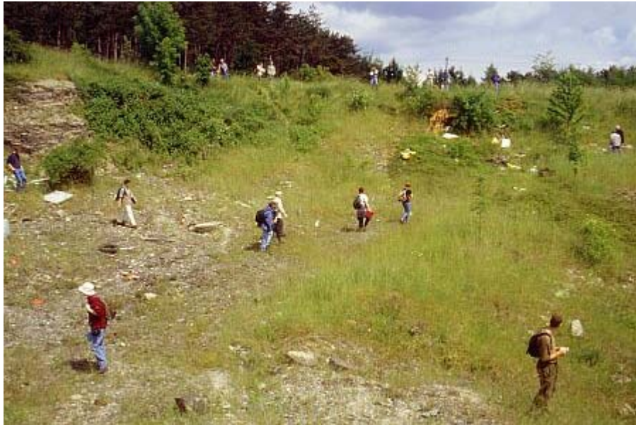
Erfassung der Lebewelt des Steinbruches am Wingelstein

Die wesentlichen Lebensraumtypen des Gebietes um Ottbergen und Bruchhausen wurden somit in die Erfassung einbezogen.