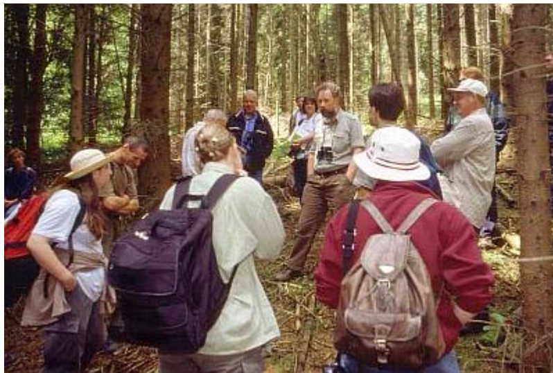
Exkursion: Station "Flora und Fauna der Wälder"

Teilnehmer z.B. über die Fauna der Nethe (durch Mitglieder des Anglervereines Bruchhausen), über die Lebewelt des Faulenbaches - eines kleinen Nethezufusses mit guter Wasserqualität - (durch Mitarbeiter der Landschaftsstation), über die Wälder des Wingelsteines (durch den zuständigen Revierförster) sowie über die Flora und Fauna der Kalk-Halbtrockenrasen des Wingelsteines (wiederum durch Mitarbeiter der Landschaftsstation) informiert wurden.