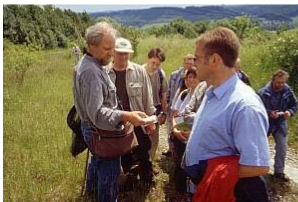
Exkursion: Station "Ökologie der Kalk-Halbtrockenrasen"

Über die reine Inventarisierung der Tier- und Pflanzenarten hinaus bildete die Einbeziehung der Öffentlichkeit diesmal einen wesentlichen Schwerpunkt: Im Rahmen mehrerer Exkursionen wurde interessierten Laien und Naturliebhabern allgemeinverständlich die Ökologie der verschiedenen Lebensraumtypen und der Artenreichtum der heimischen Lebewelt nahegebracht.