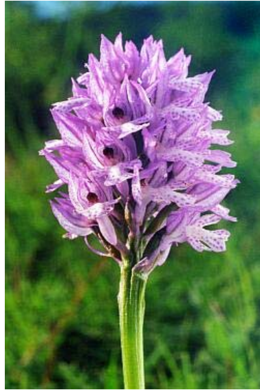
Das Dreizählige Knabenkraut ( Orchis tridentata ), eine typische Orchidee der Kalk-Halbtrockenrasen im Raum Ottbergen (Foto: Grawe)