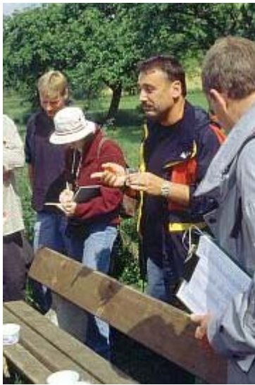
Exkursion: Station "Faulenbach" - Vorstellung der Wirbellosenfauna eines kleinen Fließgewässers