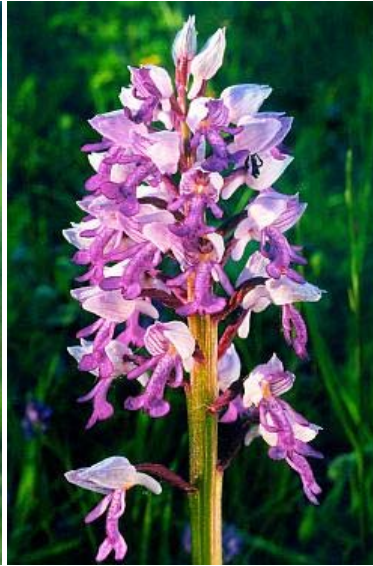
Das stark gefährdete Helm-Knabenkraut ( Orchis militaris ) findet sich am Wingelstein