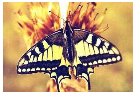
Der Schwalbenschwanz ( Papilio machaon ), einer der prächtigsten heimischen Tagfalter