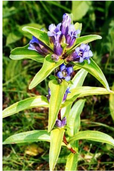
Der Kreuz-Enzian ( Gentiana cruciata ) Aufnahme einer blühenden Pflanze aus dem Vorjahr