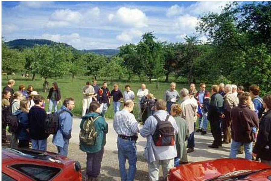
Einweisung der Teilnehmer in das Untersuchungsgebiet