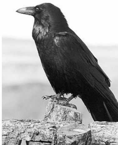
Der Kolkrabe ( Corvus corax ) ist in NRW vom Aussterben bedroht