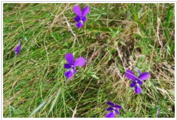
Abb. 6: Blühende Pflanzen des Westfälischen Galmei-Veilchens ( Viola guestfalica) im Galmeipflanzen-Schwermetallrasen ( Violetea guestphalicae)