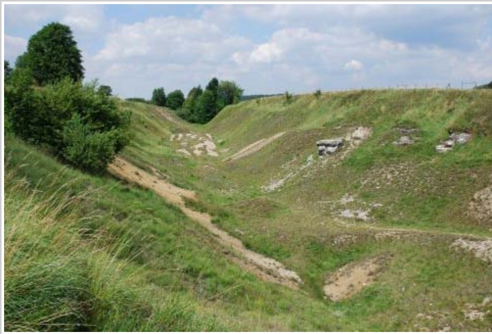
Abb. 3: Die „Bleikuhle“