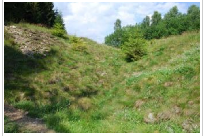
Abb. 4: Teilaspekt der Abraumhalde

Bei Blankenrode wurden vom 13. Jahrhundert bis 1936 Erze abgebaut, zunächst in so genannten „Pingen“, ab 1848 im Tagebau, später (1917/18) auch im Untertagebau. Hatte man zunächst nach Silbererzen geschürft, wurden später Bleiglanz und Galmei abgebaut. (vgl. Die Naturschutzgebiete in Paderborn 1995). Die „Bleikuhle“, ein offener Graben von etwa 300 m Länge, 50 m Breite und 4 - 12 m Tiefe, im Kreis Paderborn und die Abraumhalde im Kreis Höxter zeugen noch heute von den Bergbauaktivitäten (Abb. 3 und 4).