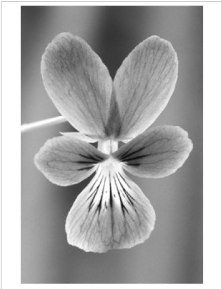
Abb. 1: Das 10 - 15 Zentimeter hohe Westfälische Galmei-Veilchen ( Viola guestphalica ) weist gleichmäßig blauviolette Kornblätter auf. Zum Blütenzentrum hin ist eine strichförmige, dunkle Aderung erkennbar. Die kräftig gefärbten Blüten können von Mai bis Oktober bewundert werden.

Normalerweise wird das Vorkommen dieser Art immer mit dem Kreis Paderborn in Verbindung gebracht, aber tatsächlich greift das Vorkommen auch auf die Kreise Höxter und den Hochsauerlandkreis über. Im Kreis Höxter besiedelt es in individuenstarken Beständen die Abraumhalde der Bleikuhle (vgl. Abb. 3), im Hochsauerlandkreis ist es im Bereich einer Feuchtwiese am Wäschebach unterhalb der Bleikuhle anzutreffen. Der gesamte Bereich ist geschützt als Teil des NSG „Bleikuhlen und Wäschebachtal“.