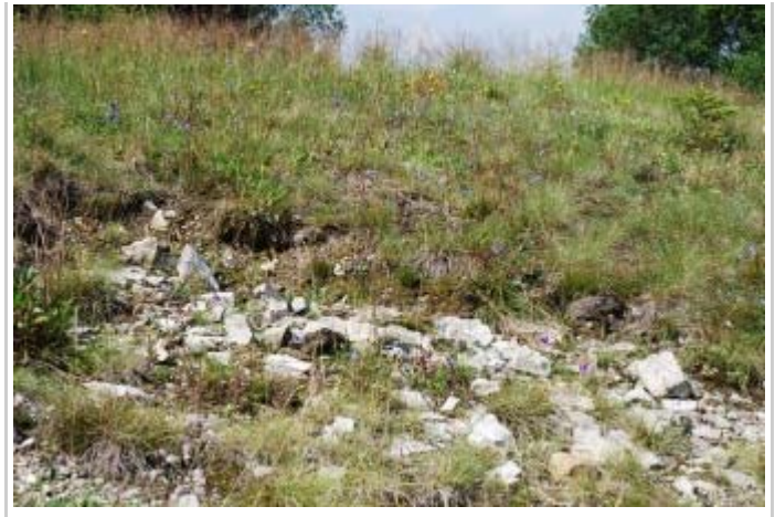
Abb. 5: Galmeipflanzen-Schwermetallrasen auf der Abraumhalde ( Violetum guestphalicae ; 25.07.2007)