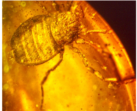
Fig. 2. The rare Burmese amber ricinuleid, Poliochera cretacea Wunderlich, 2012 (Arachnida: Ricinulei), which is described in Chapter 11 of the above book. (specimen in the Wunderlich collection)

and even vertebrate life of not only rare surviving forms but also recently extinct ones. Among the invertebrate life forms are spiders (Fig. 1) and in the present work, J. Wunderlich describes a new tribe, two new genera and three new species of spiders in this semi-fossilized resin. While it is still too early to tell if these new fossil spiders are extinct or simply have avoided capture, it shows how this medium can be used to augment the biodiversity of life in Madagascar. A list of insects described from Madagascar copal is available in POINAR et al. (2001).