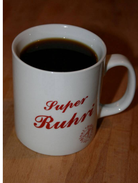
Abb. 2: Ne Tass Kaff (C. BUCH).