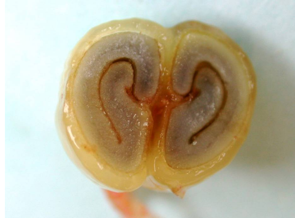
Abb. 10: Coffea arabica , Querschnitt durch den Steinkern einer Kaffeekirsche mit Endosperm und S-förmigem Embryo (A. HÖGEMEIER).