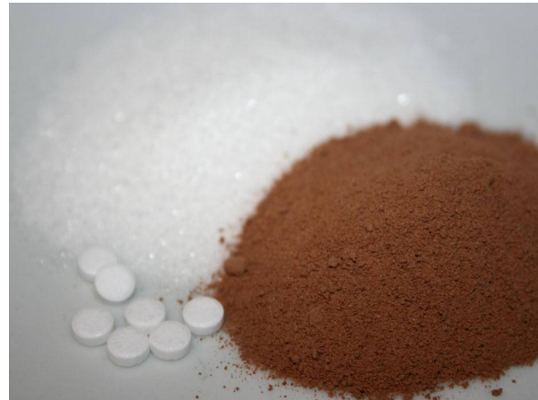
Abb. 14: Zutaten zum Kaffee: Zucker, Süßstoff, Kakao (C. BUCH).

Skurril ist die Verwendung von Kaffeebohnen, die vor ihrer Weiterverarbeitung von auf den Inseln Sumatra und Java lebenden Schleichkatzen gefressen, ausgeschieden und dadurch fermentiert wurden. Dieses Kaffeeprodukt ist durch diesen aufwändigen "Umweg" extrem teuer.