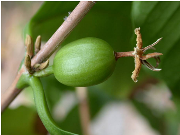
Abb. 7: Coffea arabica , junge Kaffee-Frucht (unterständiger Fruchtknoten) mit eingetrockneten Resten der Blütenhülle (A. HÖGGEMEIER).