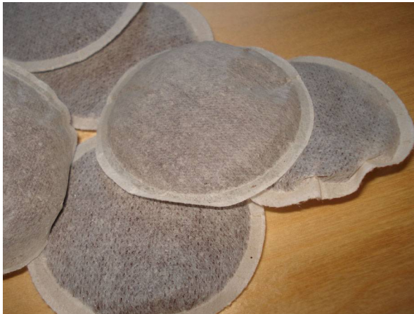
Abb. 13: Kaffeepads (I. HETZEL).