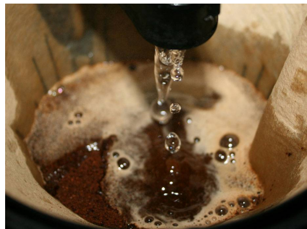
Abb. 12: Filterkaffee (C. BUCH).