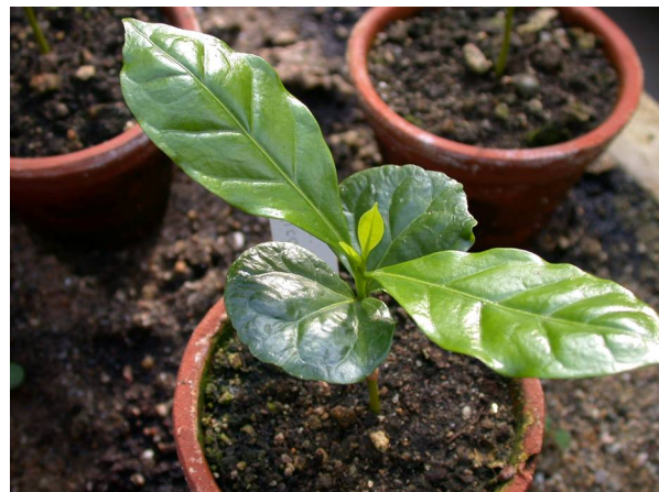
Abb. 4: Coffea arabica , Kaffee-Sämlinge (A. HÖGGEMEIER).