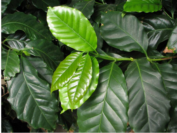
Abb. 1: Coffea arabica , Zweig (V. M. DÖRKEN).

Kopfschmerzen. Im Mund eine tote Ratte. Draußen ist es hell. Eigenes Bett – soweit alles klar. Im Flur Schuhe, Hose, leere Sektflaschen, zerknüllte Luftschlangen, Erinnerungsfetzen. Im Wohnzimmer schnarcht etwas. Küche. Vorbei an schmutzigem Geschirr, noch mehr leeren Flaschen, undefinierbarem. Ein Plan muss her. Aber erst mal ein Kaffee!