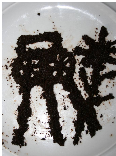
Abb. 16: Dieser Kaffeesatz sagt viele bemerkenswerte Pflanzenfunde in Bochum für das Jahr 2012 voraus (C. BUCH).