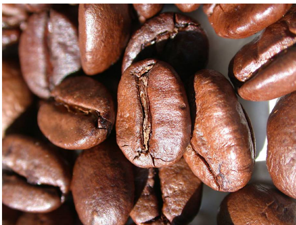
Abb. 11: Geröstete Kaffeebohnen.

Bei der Verarbeitung und Aufbereitung der Kaffeekirschen zur Handelsware werden zuerst die gesamte Fruchtwand und das Silberhäutchen entfernt. In dieser Form spricht man von Rohkaffee, der das Endosperm samt Embryo umfasst. Graugrüner Rohkaffee kommt in die Großröstereien der Verbraucherländer, in denen das Rösten sowie die Zusammenstellung der Sorten nach Geschmacksvorlieben stattfindet. Die Zubereitung erfolgt zum Teil regional unterschiedlich als Aufguss direkt in der Tasse oder durch einen Filter (Abb. 12), durch Extraktion unter hohem Druck wie beim Espresso oder als löslicher Kaffeeextrakt. Daneben gibt es die verschiedensten Kombinationen z. B. mit Milch als Milchkaffee, Cappuccino oder Latte macchiato. So werden in großen Kaffeehausketten bis zu 40 verschiedene Kaffeegetränke angeboten – von "Strawberries & Cream Frappuccino® blended beverage" bis zum weihnachtlichen "Lebkuchen Latte" ( www.starbucks.de ). Die modernste Entwicklung in der Kaffeeindustrie sind zahlreiche Varianten von Kaffeemaschinen, die mit Pads oder Kapseln funktionieren (Abb. 13).