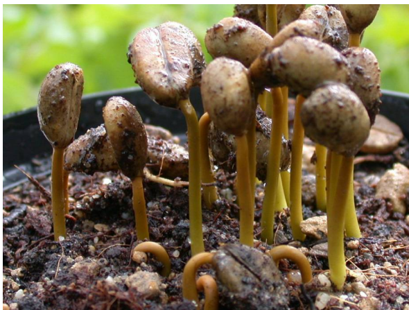
Abb. 3: Coffea arabica , Kaffee-Keimlinge.

Was uns an diesem Neujahrsmorgen ganz weit nach vorne bringt, gehört zur wirtschaftlich wichtigsten Gattung aus der großen, weltweit verbreiteten Pflanzenfamilie der Rubiaceae und zur Gattung Coffea . Die am häufigsten kultivierten Arten sind C. arabica (Arabica-Kaffee), ursprünglich aus Äthiopien und Sudan, und C. canephora (Robusta-Kaffee), der ursprünglich aus West- und Zentral-Afrika, Sudan, Uganda und Angola stammt (JENNY & STEINECKE 1999).