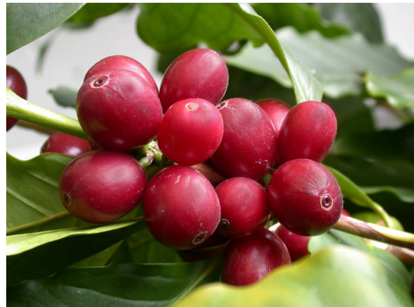
Abb. 8: Coffea arabica , reife Kaffee-Früchte, sog. "Kaffeeirschen" (A. HÖGGEMEIER).

Nach der Befruchtung dauert es sieben bis neun Monate, je nach Art und Sorte, bis die zunächst grünen Früchte zu roten Steinfrüchten, den sog. Kaffeeirschen, heranreifen. Die Kaffeeirschen haben außen eine saftige Fruchtwand, das Exo- und Mesokarp, und nach innen (meist) zwei feste Steinkerne, die von der harten inneren Fruchtwand, dem Endokarp,