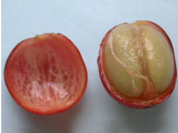
Abb. 9: Coffea arabica , geöffnete Kaffeekirsche mit rotem fleischigem Mesokarp und den von festem, hornartigem Endokarp umgebenen Samen (Steinkerne).

umgeben sind. Die beiden Steinkerne liegen sich mit ihren abgeflachten Seiten gegenüber (Abb. 9). Gelegentlich entwickelt sich nur eine Samenanlage zu einem ovalen Kern, der als Perlkaffee bezeichnet wird. Unter dem Endokarp liegt die Samenschale, das sog. Silberhäutchen. Es umgibt das Nährgewebe (= Endosperm) mit dem darin liegenden S-förmigen Embryo (Abb. 10). Reste dieses Silberhäutchens sind in der Furche der gerösteten Kaffeebohnen manchmal zu finden.