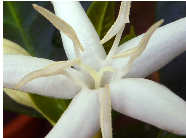
Abb. 6: Coffea arabica , Nahaufnahme einer Kaffee-Blüte mit 5 Staubblättern und zwei Narben (A. HÖGGEMEIER).