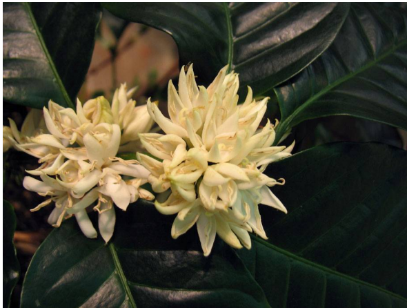
Abb. 5: Coffea arabica , blühender Kaffeestrauch.

In den Achseln der gegenständigen, ledrig-glänzenden Blätter (Abb. 1) entwickeln sich vielblütige Trugdolden mit weißen, sternförmigen Blüten. Sie haben eine fünfzipfelige Kronröhre und fünf damit verwachsene Staubblätter (Abb. 5 & 6), einen unterständigen Fruchtknoten (Abb. 7) mit zwei Samenanlagen und einem Griffel mit zwei Narben (Abb. 6).