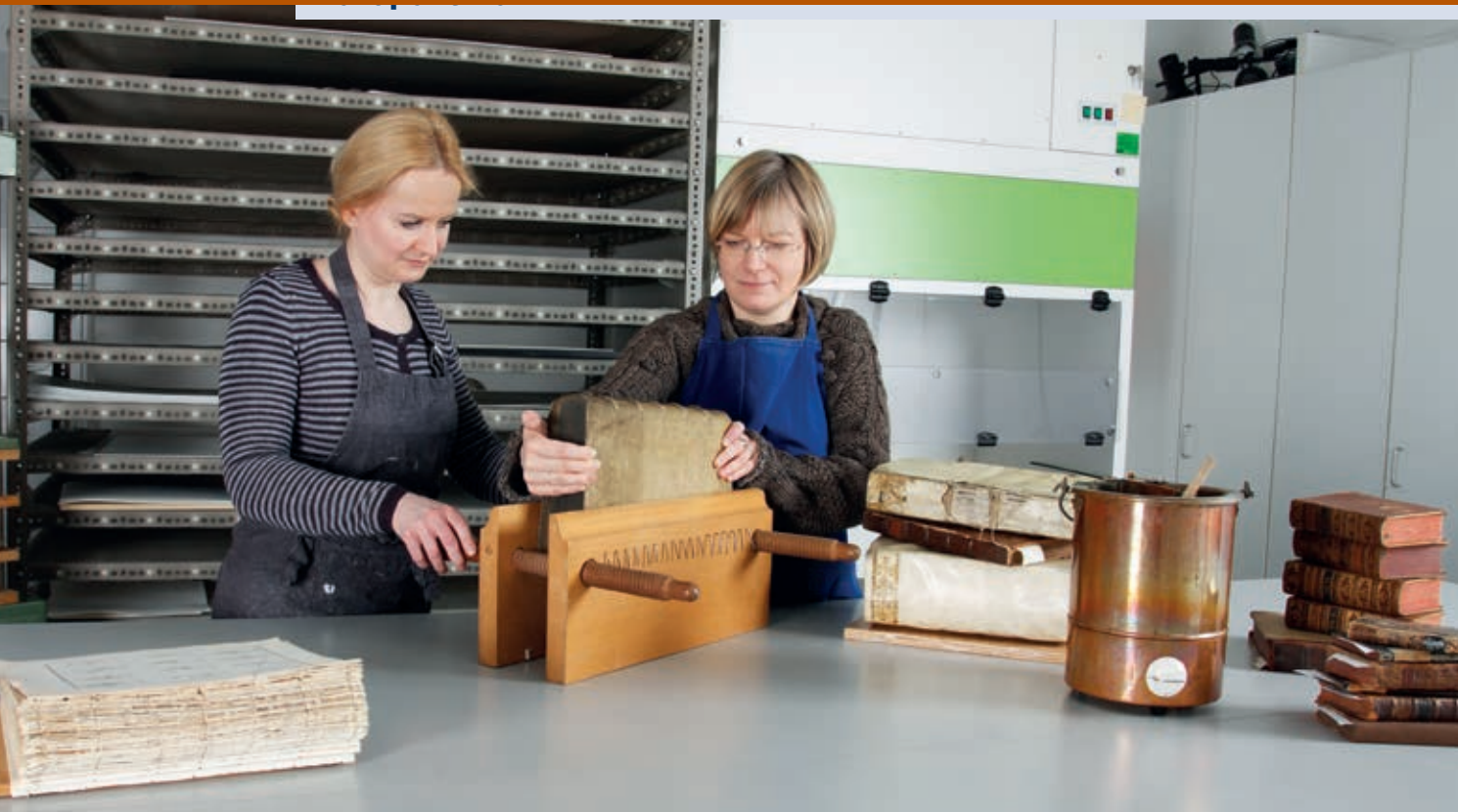
Im Freien Deutschen Hochstift werden kostbare Handschriften und Bücher sorgsam gepflegt und – wenn nötig – restauriert.