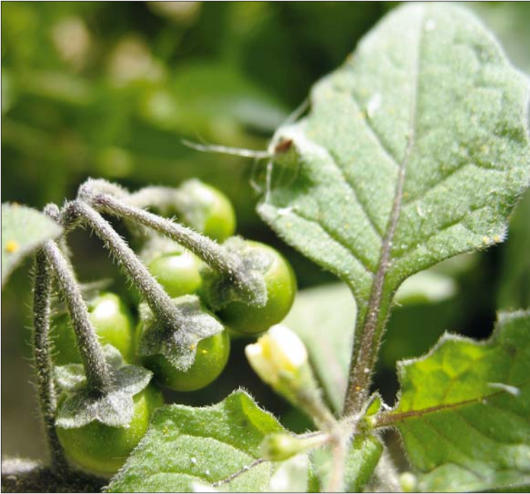
Abb. 5: Solanum nigrum ssp. schultesii , Halle, Theodor-Lieser-Str., Rabatten, Helmholtz-Zentrum f. Umweltforschung, 13.10.2007.