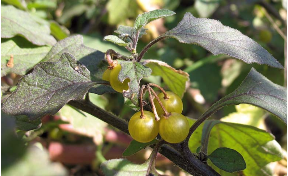
Abb. 4: Solanum villosum s. str. mit reifen Früchten, Trebnitz, 23.09.2007.

Die Intensität ist nach eigenen Beobachtungen von der Umgebungstemperatur und der Sonneneinstrahlung abhängig. Der charakteristische und ausgeprägte Geruch ist u. E. ein gutes Unterscheidungsmerkmal der Arten im Gelände. Zusammen mit den anderen Unterscheidungsmerkmalen sollte es eine gute Begründung für die Unterscheidung beider Sippen im Artrang geben.