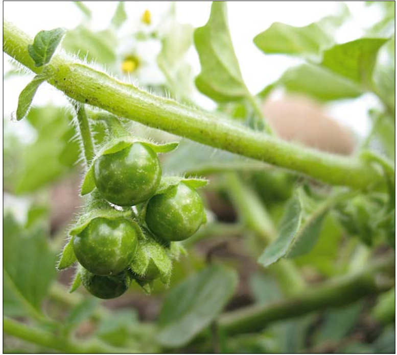
Abb. 6: Solanum physalifolium . Acker- rand, südl. Leuna, 21.08.2007.

näheren Umkreis weitere Fundorte, z. T. mit wenigen oder einzelnen Pflanzen aufgefunden. Die Verbreitung scheint sowohl über den Wasserweg (Ellerbach – Saale, Floßgraben) als auch durch die Landwirtschaft zu erfolgen.