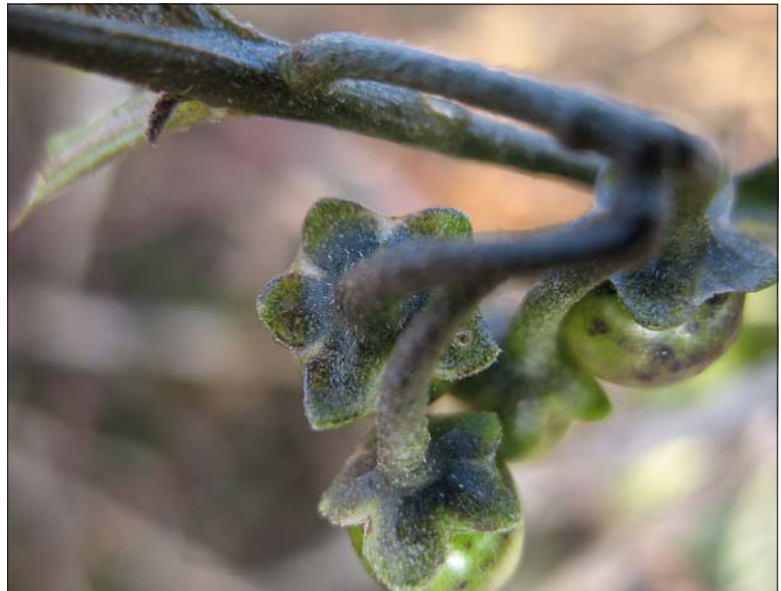
Abb. 3: Solanum alatum × nigrum ssp. nigrum (?). Wachhügel südwestlich Seeburg, 17.10.2007.