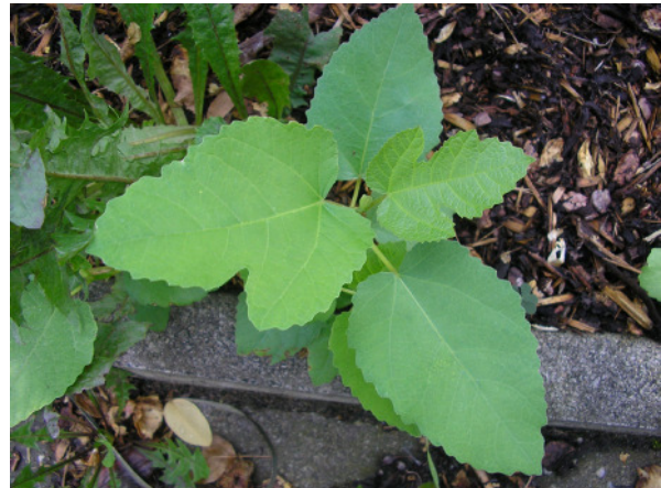
Abb. 6: Ficus carica , verwildert in einem Blumenbeet in der Herner Innenstadt (2008).