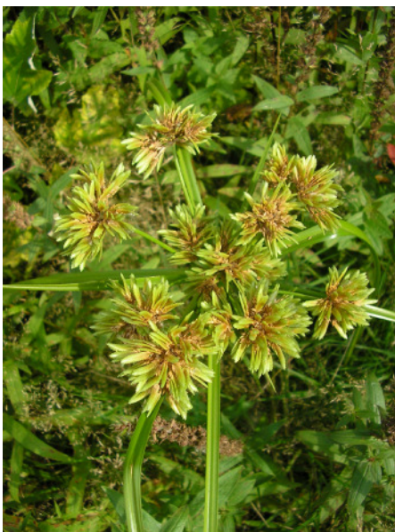
Abb. 3: Cyperus eragrostis am Rhein-Herne-Kanal in Herne-Crange (2008).

GE-Ückendorf (4408/44): Ca. 500 Ex. auf dem Gelände der ehemaligen Zeche Alma. Hier zuletzt 2000 von C. KERT & M. SCHÜRMANN gefunden, 07.09.2008, PG.