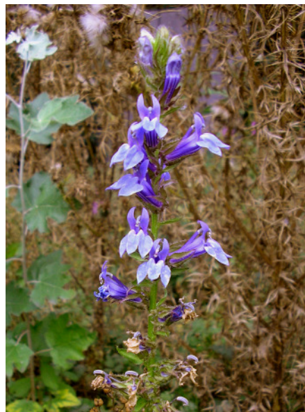
Abb. 8: Lobelia siphilitica auf einer Brache am Rhein-Herne-Kanal in Crange (2008, Foto: P. GAUSMANN).