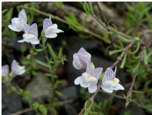
Abb. 7: Linaria repens auf einer Bahnbrache in Bochum-Dahlhausen (2008, Foto: A. JAGEL).

HER-Crange (4409/31): 2 Ex. auf einer Brachfläche in der Nähe des Rhein-Herne-Kanals, 01.09.2008, PG.