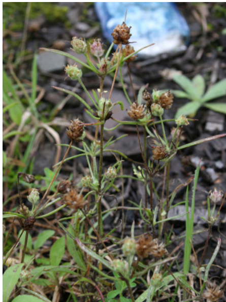
Abb. 9: Plantago arenaria in Herne-Horsthausen (2008).

HER-Horsthausen (4409/14): Mehrere Pflanzen auf dem Rangierbahnhof, 20.08.2008, PK.