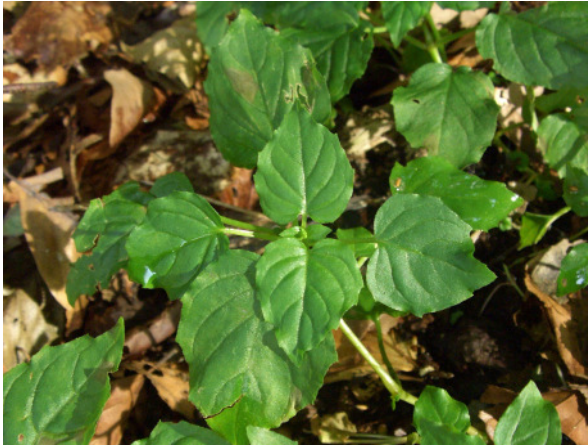
Abb. 1: Circaea intermedia im Lottental in Bochum (2008).