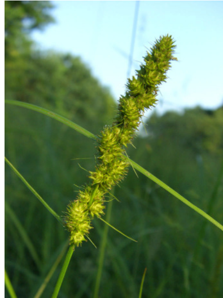
Abb. 2: Carex vulpinoidea in Bochum-Ehrenfeld (2008).