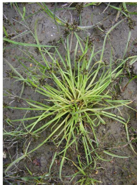
Abb. 4: Cyperus fuscus in Gelsenkirchen auf der Zechenbrache Alma (2008).