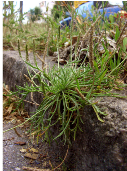
Abb. 10: Plantago coronopus auf einer Verkehrsinsel in Dortmund-Lütgendortmund (2008).