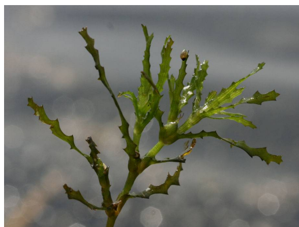
Abb. 2: Najas marina subsp. intermedia, Zweig (Duisburg-Homberg, 04.08.2012,).