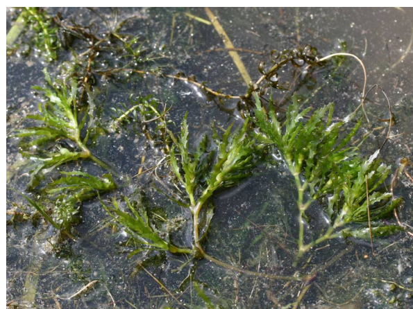
Abb. 1: Najas marina subsp. intermedia, am Ufer eines Abgrabungsgewässers am Niederrhein in Duisburg-Homberg (04.08.2012,).