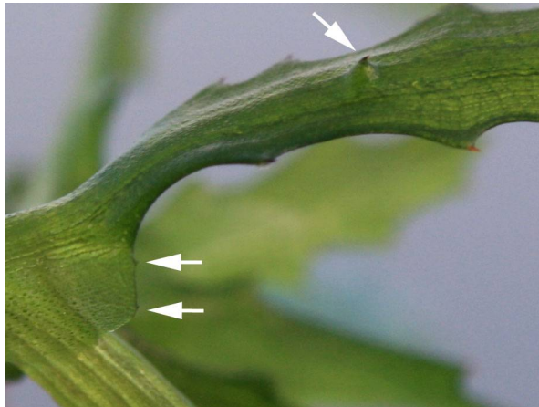
Abb. 7: Najas marina subsp. intermedia, Blatt mit Stachel auf der Mittelrippe der Blattunterseite (oberer Pfeil) und zwei Zähnen an der Blattscheide (untere Pfeile) (Duisburg-Homberg, 04.08.2012,).