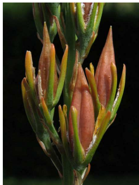
Abb. 6: Narthecium ossifragum , Früchte (A. JAGEL).