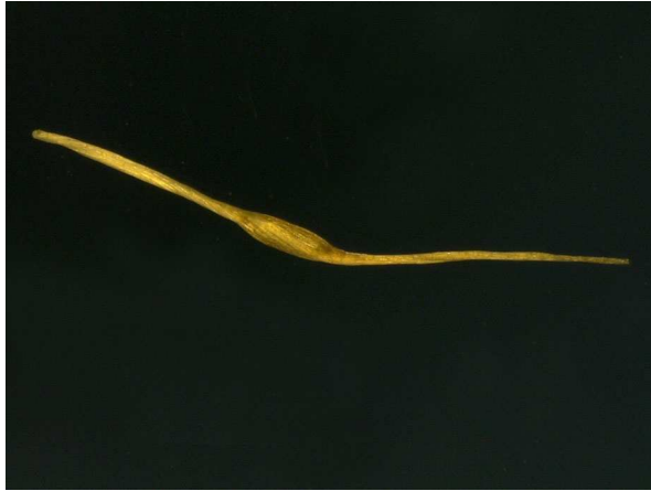
Abb. 7: Narthecium ossifragum , einzelner, feilspanförmiger Samen (V. M. DÖRKEN).