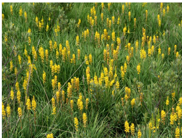
Abb. 1: Narthecium ossifragum, blühender Bestand im Further Moor zwischen Leichlingen und Langenfeld, Bergisches Land, NRW (05.07.2010,).