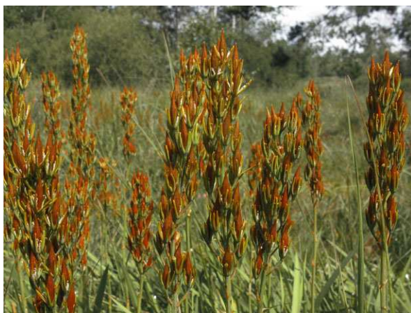
Abb. 5: Narthecium ossifragum, fruchtender Bestand in der Wahner Heide (13.08.2011,).

Nach der Blütezeit (Juli-August) bilden sich dünnwandige, ovale dreiteilige Kapsel Früchte aus (Abb. 5 & 6), die sich bei der Reife am Rücken der Fruchtblätter öffnen (loculizid). Sie enthalten hellgelbe, feilspanförmige Samen, oben und unten mit einem fadenförmigen Anhängsel (Abb. 7 & 8). Im Herbst verfärben sich die Fruchtsstände dunkelorange, sie halten sich im Gelände fast ein Jahr.