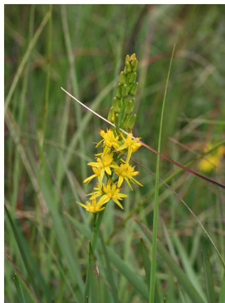
Abb. 2: Narthecium ossifragum, Blütenstand (05.07.2010,).