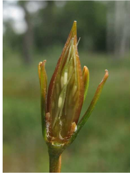
Abb. 8: Narthecium ossifragum , Längsschnitt durch eine Frucht mit Samen (A. JAGEL).