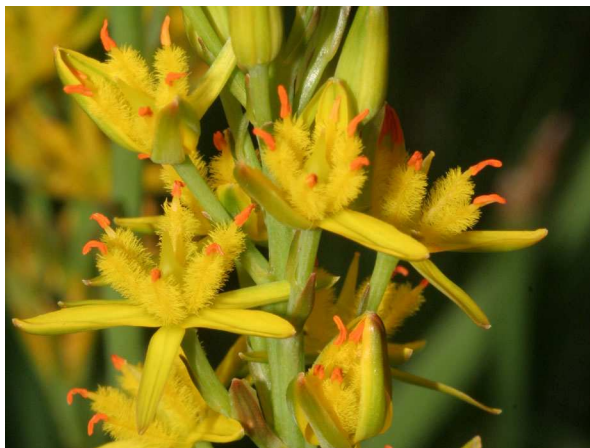
Abb. 3: Blüten.

Über die Funktion dieser Haare wurde in der Vergangenheit viel spekuliert. Man nahm an, dass sie eine Einrichtung zum Auffangen von Pollen im Rahmen von Windbestäubung seien oder aber bestäubenden Insekten zum Festhalten oder als Futterhaare dienen könnten (SCHUMACHER 1947). Heute interpretiert man die Haare so, dass sie den Pollen sammeln und die Pollenkörner dann in von den Haaren ebenfalls fixierten Regentropfen zur Bestäubung zu den Narben schwimmen (MABBERLEY 2008). Sehr ähnliche Haare in Blüten von Königskerzen ( Verbascum spp.) interpretiert man allerdings als Futterattrappen (DÜLL & KUTZELNIGG 2005): Dem Insekt wird mehr Pollen vorgegaukelt, als ihm letztlich angeboten wird. Die duftenden Blüten haben jedenfalls keinen Nektar und bieten lediglich Pollen an. Als Bestäuber wurden Honigbienen und Hummeln, weitere Wildbienen sowie Fliegen beobachtet (SCHUMACHER 1947).