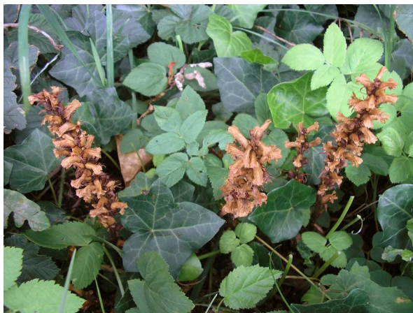
Abb. 2: Teil der Population von verblühter Orobanche hederæ am Saum eines Feldweges in Dortmund-Lütgendortmund mit Wirtspflanze Hedera helix sowie Aegopodium podagraria als Begleiter (09.08.2010,).

Im August 2010 konnte vom Erstautor eine kleinere Population von Orobanche hederæ in der Nähe von Schloss Dellwig in Dortmund-Lütgendortmund am Saum eines landwirtschaftlichen Wirtschaftsweges gefunden werden (MTB 4410/33, vgl. auch BOCHUMER BOTANISCHER VEREIN 2011).