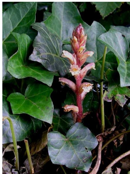
Abb. 3: Orobanche hederæ am Fundort in Dortmund-Lütgendortmund (28.07.2011,).