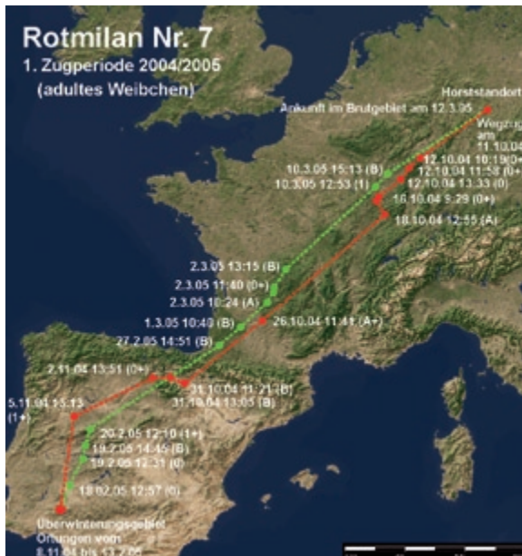
Abb. 6: Weg- und Heimzug des Rotmilans 7 in der Zugperiode 2004/2005. – Autumn and spring migration of the Red Kite 7 in the migration periods 2004/2005.