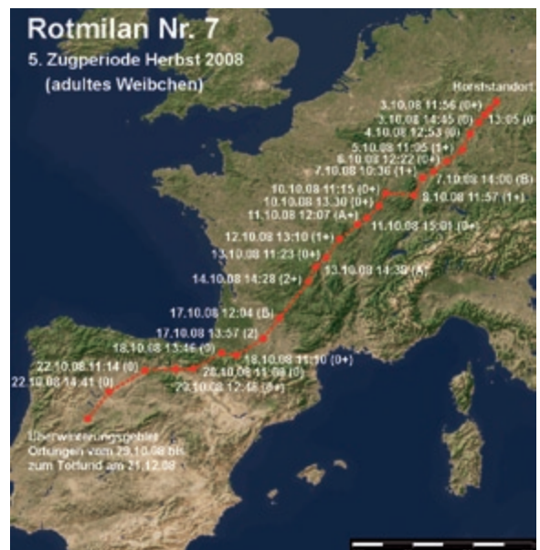
Abb. 9: Wegzug des Rotmilans 7 im Herbst 2008. – Autumn migration of the Red Kite 7 in 2008.