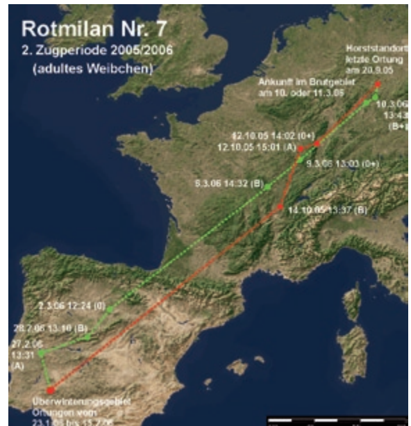
Abb. 7: Weg- und Heimzug des Rotmilans 7 in der Zugperiode 2005/2006. – Autumn and spring migration of the Red Kite 7 in the migration periods 2005/2006.

triert werden konnte. Dafür benötigte er etwa vier Wochen (27–29 Tage). Pro Tag flog der Rotmilan also im Durchschnitt reichlich 80 km.