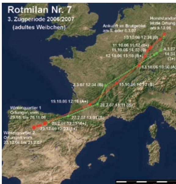
Abb. 8: Weg- und Heimzug des Rotmilans 7 in der Zugperiode 2006/2007. – Autumn and spring migration of the Red Kite 7 in the migration periods 2006/2007.

2 - Die in Klammern angegebenen Werte sind Abschätzungen der tatsächlichen Wegzug-, Ankunftsstermine oder der Zugdauer, die durch Hochrechnung aus den vorhergehenden oder nachfolgenden Streckenabschnitten und Ortungen entstanden sind. – The figures in brackets are estimates of the actual values. The figures in brackets are estimates of the actual departure on migration, arrival or duration of migration. The values are derived from an extrapolation of the previous or subsequent migration flight distances and fixes taken.