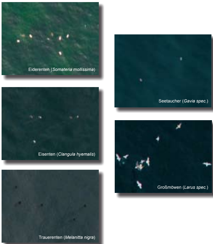
Abb. 2: Repräsentative Seevogelfotos in 108-prozentiger Vergrößerung, die in 200 m Flughöhe mit einer Trimble AIC 45 (39 Mpixel) aufgenommen wurden. Eine höhere Auflösung der Kamera würde eine Befliegung in noch größeren Höhen erlauben und damit die Bewegungsunschärfe bei gleicher Belichtungszeit verringern. – Representative aerial orthophotos of sea birds enlarged by 108% taken with a Trimble AIC 45 (39 Mpixel) at an elevation of 200 m. A camera with a higher resolution would allow surveys at higher altitude which would reduce motion blur.

Mit der eingesetzten Technik konnten die im Untersuchungsgebiet anwesenden Wasservogelarten fotografisch erfasst und bestimmt werden. Neben den dominierenden Meeresenten wurden auf dem Fotoflug Seetaucher, Kormorane, Silber- und Mantelmöwen in geringer Anzahl nachgewiesen (vgl. Abb. 2). Die drei häufigen Meeresen-