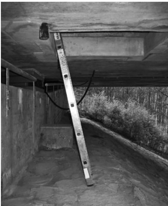
Abb. 2: Einsteig in die Brücke. – Entrance to the chambers.

Die Überlebensrate der Jungvögel war 2007 mit 9,3% gering. Nur 7 von 75 Jungen haben überlebt und die Nester erfolgreich verlassen. Der Grund dafür war höchstwahrscheinlich die extrem lange Schlechtwetterperiode während des Sommers. Im Durchschnitt erreichten die überlebenden Nestlinge ihre höchste Körpermasse von 43,8 \pm 9,0 g am 31. Tag. Die Jungen verließen mit einem Durchschnittsalter von 38 (32 - 43) Tagen das Nest. Zu diesem Zeitpunkt wogen die Jungvögel durchschnittlich 41,2 \pm 8,3 g. Ähnliche Körpermassen von Mauerseglern fanden Lack & Lack (1951) und Martins & Wright (1993).