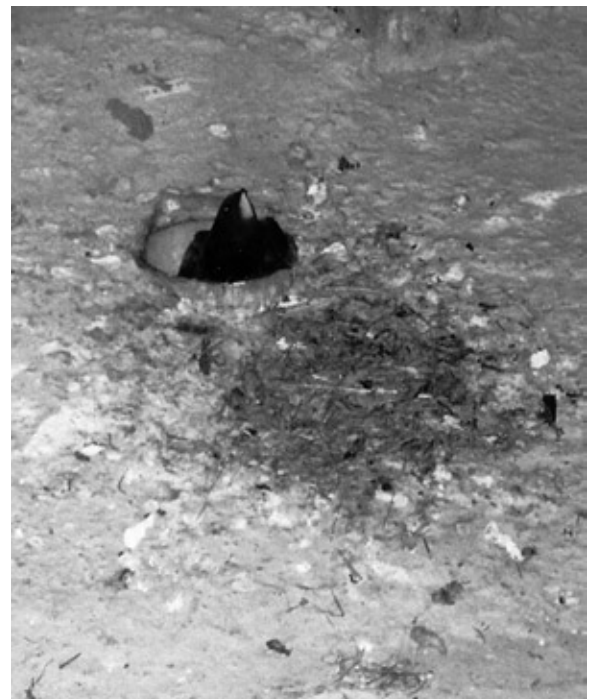
Abb. 3: Ein Mauersegler kehrt zum Nest zurück. – A common swift returns to the nest.